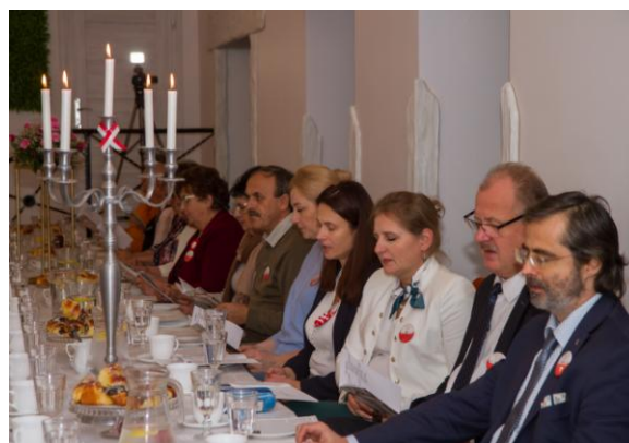
Biesiada z użyciem śpiewników „Kocham Polskę”