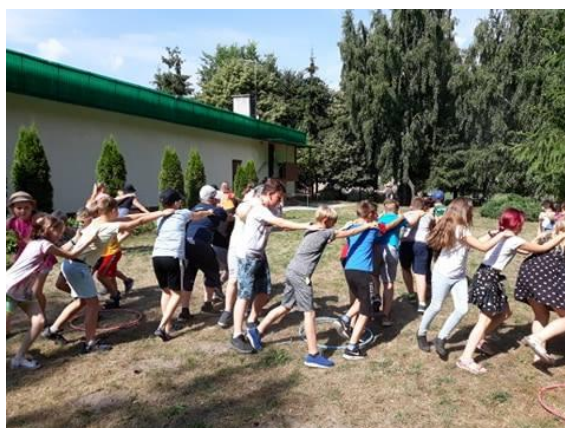
Gry zabawy ruchowe