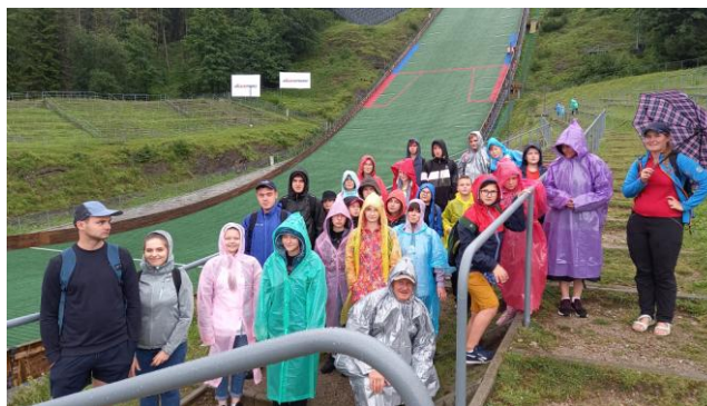
Na skoczni narciarskiej w Zakopanem

Całą sobotę poświęciliśmy na zwiedzanie Zakopanego. Przy niezbyt sprzyjającej pogodzie, w płaszczach przeciwdeszczowych zobaczyliśmy m.in. skocznie, Dom do góry nogami, Krupówki, Gubałówkę, Cmentarz Zasłużonych na Pęksowym Brzyzku oraz Sanktuarium Matki Bożej Fatimskiej. Po powrocie na miejsce noclegowe, resztę wieczoru spędziliśmy wspólnie muzykując.