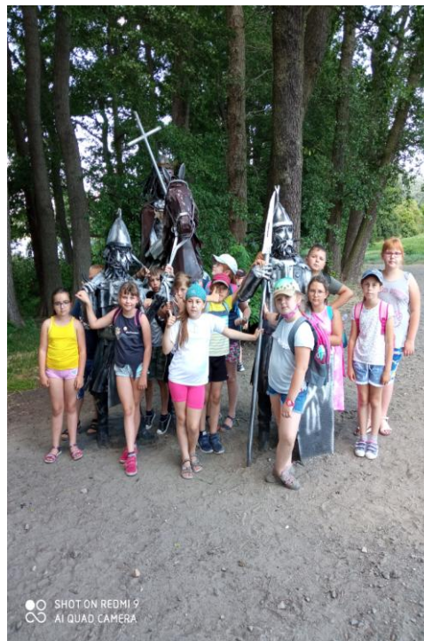
W Lednickim Parku Krajobrazowym wśród wojów