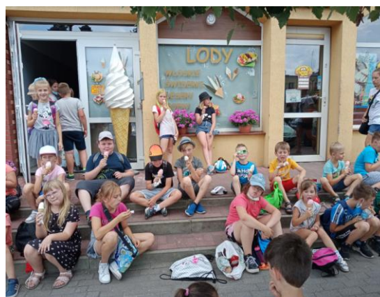
Lody dla ochłody