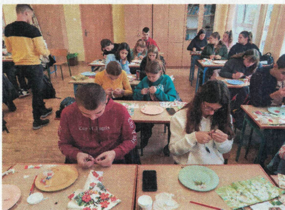
Dekorowanie talerzyków w stylu decoupage.