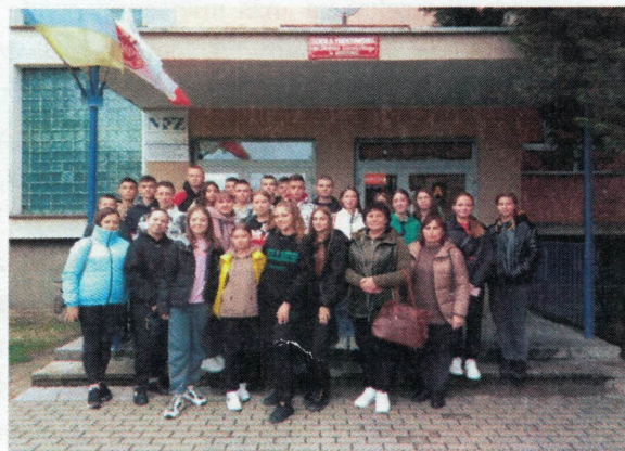
Grupa ukraińska przed SP w Mieścisku