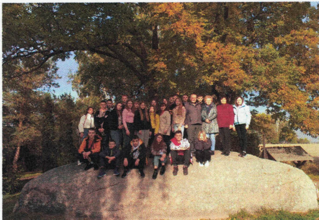
Na kamieniu Św. Wojciecha w Budziejewku

opowiedział nam o budowie kościoła (1848-1858) i legendzie o kamieniu św. Wojciecha. Pokazał drzewa, które zostały posadzone ku czci św. Karola, Jakuba, Stefana i Michała. Opowiedział też, dlaczego w 2019 roku (w rocznicę odzyskania przez Polskę niepodległości) posadzono tu 100 drzew i 100 kamieni. Utworzono Park Pamięci.