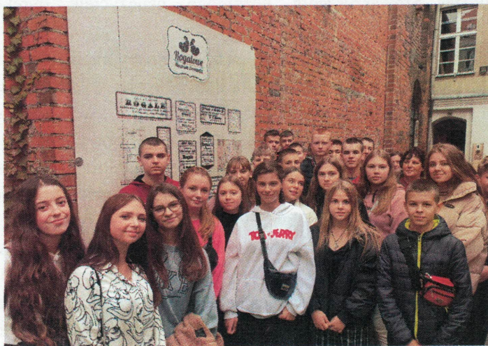
Przed Rogalowym Muzeum w Poznaniu

W środę czeka nas ciekawa wycieczka do Poznania, wspaniałego i przytulnego miasta, bogatego w swoją starożytną historię. Na placu targowym uderzyła nas jego wielkość i piękno ratusza, wiele budynków w starym stylu. Tutaj odwiedziliśmy Narodowe Muzeum Instrumentów Muzycznych, gdzie prezentowanych jest wiele eksponatów z różnych epok. Fascynujące były warsztaty wypieku rogalów w Muzeum Rogala w Poznaniu, gdzie uczniowie zapoznali się z historią instytucji, procesem wytwarzania rogalików. Uczniowie będąc uczestnikami pokazu mogli też sami przygotować smakołyki. Za to otrzymali certyfikaty kulinarne uprawniające do produkcji rogalów i smakowali wykonane wyroby.