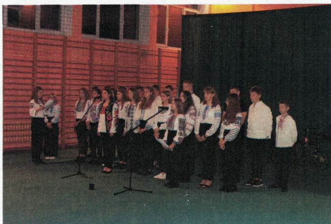
Występ uczniów z Ukrainy w SP w Mieścisku