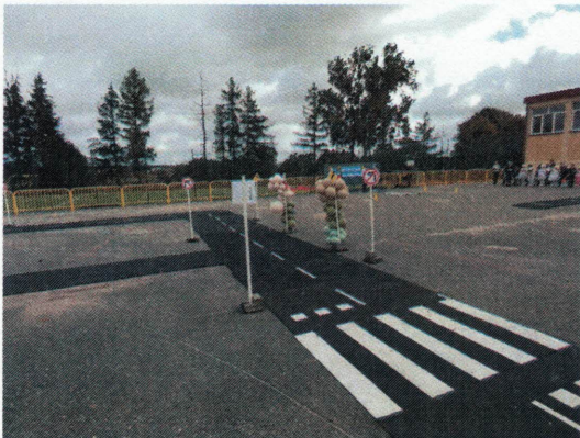
Widok miasteczka ruchu drogowego