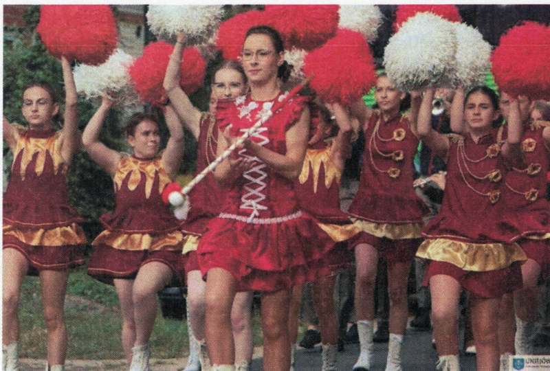
Musztra paradna mażoretek

Kolejny przystanek był już w Księżych Młynach, gdzie znajdował się Ośrodek Szkoleniowo-Wypoczynkowy „VANTUR”, w którym zjedliśmy pyszny obiad i zamieszkaliśmy w pokojach. Największą atrakcją dnia był trzygodzinny pobyt na termach, szczególnie podobały się zjeżdżalnie. Sanus per aquam , czyli zdrowie przez wodę – to naczelną dewizą term. Od 2012 roku Uniejów jest pierwszym w kraju uzdrowiskiem termalnym. Woda geotermalna o temperaturze 70 °C wydobywana jest z głębokości 2 km. Kompleks termalno-basenowy to nowoczesna budowla, która kryje mnóstwo atrakcji dla każdego, niezależnie od wieku. Tu podziękowania uczestników przekazujemy miastu Uniejów za ufundowanie tej atrakcji. Dzień zakończył się próbą orkiestry przygotowującej się do festiwalu orkiestr dętych, który odbył się w sobotę (trzeciego dnia pobytu).