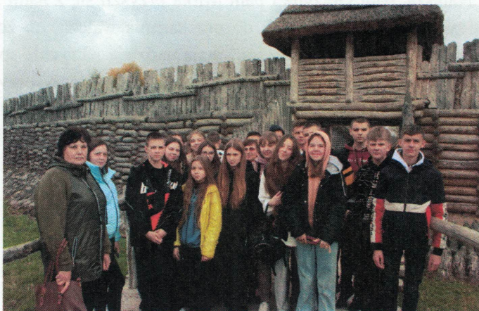
Przed zrekonstruowaną osadą przed 2500 lat w Biskupinie

Następnie udaliśmy się do miejscowości Biskupin. Znajduje się tu starożytna osada licząca 2500 lat. Tu zobaczyliśmy stylizowane mieszkanie z X wieku, zrobiło to niesamowite wrażenia. Osada ta została zalana w bagnie, ale archeologom z Gdańska udało się odtworzyć i stworzyć coś na wzór ówczesnych domów i budynków. Z powodu braku czasu nie zdążyliśmy zobaczyć wszystkiego w szczegółach, ale skala i realność tego, co zobaczyliśmy, robią wrażenie. Zwiedzamy też muzeum, zapoznajemy się z różnymi aspektami życia i działalności starożytnych ludzi, robimy zdjęcie na pamiątkę i wracamy na trasę.