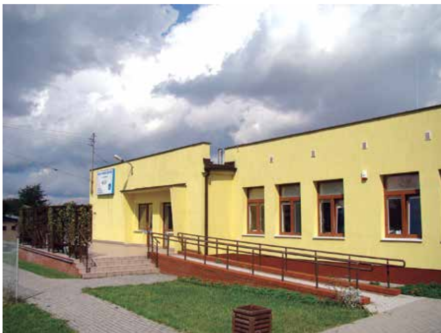
▲ Zakład Aktywności Zawodowej w Gołaszewie