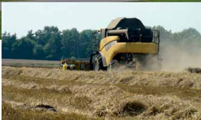
► W gospodarce gminy dominuje nowoczesne rolnictwo

oraz zespołem wykwalifikowanych specjalistów. Firma jest jednym z największych producentów kosmetyków w Polsce i Europie w sektorze Private-Label. W ciągu minionych lat poniesiono ogromne nakłady inwestycyjne na modernizację i rozbudowę strefy produkcyjnej, biurowej i magazynowej (w 2020 roku - budowa i oddanie do użytku kolejnej hali oraz biurowca), a także na zakup nowoczesnych linii produkcyjnych. Od 2012 r. Serpol posiada własne laboratorium mikrobiologiczne.