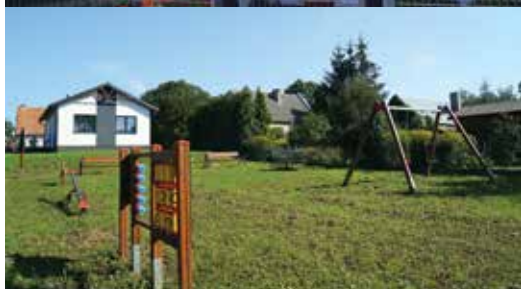
▲ Plac zabaw