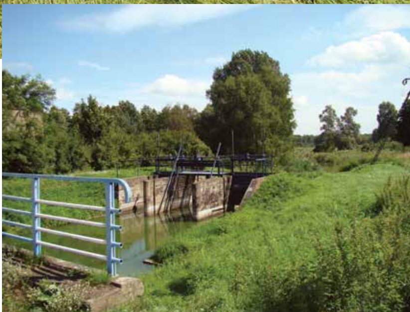
▲ Jaz na Wełnie w okolicy Gorzewa