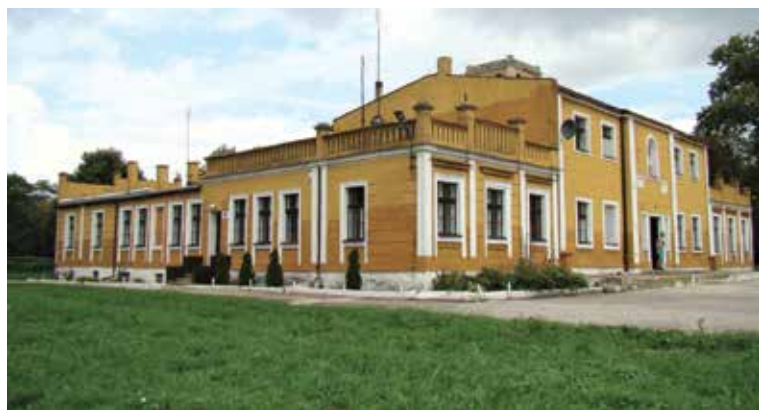
▲ Zabytkowy pałac

We wsi są: boisko sportowe, świetlica, dwa sklepy. Działa tu Ochotnicza Straż Pożarna, która posiada remizę i wóz bojowy.