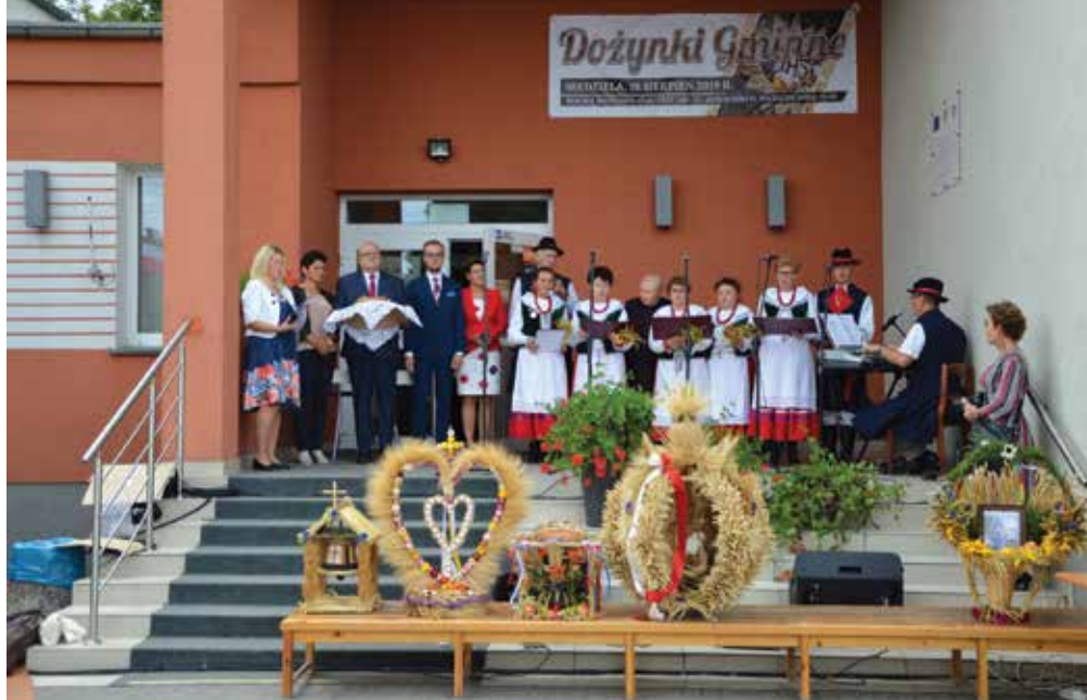
▲ Zespół folklorystyczny „Sarbianie”