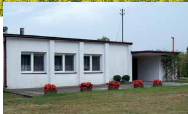
▲ Światlica w centrum wsi