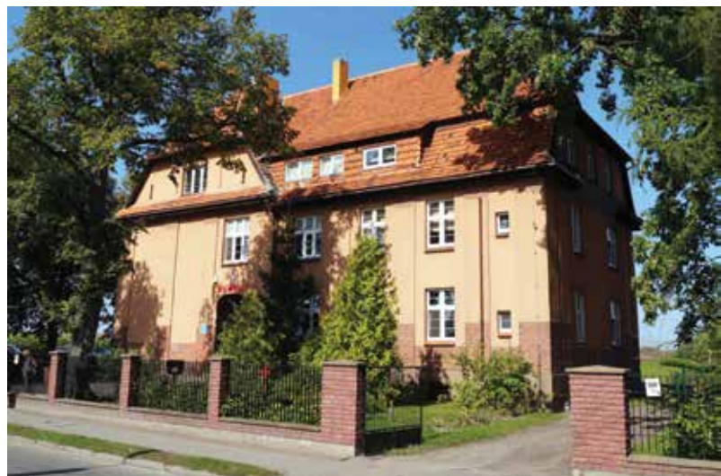
▲ Szkoła Podstawowa i Przedszkole w Popowie Kościelnym