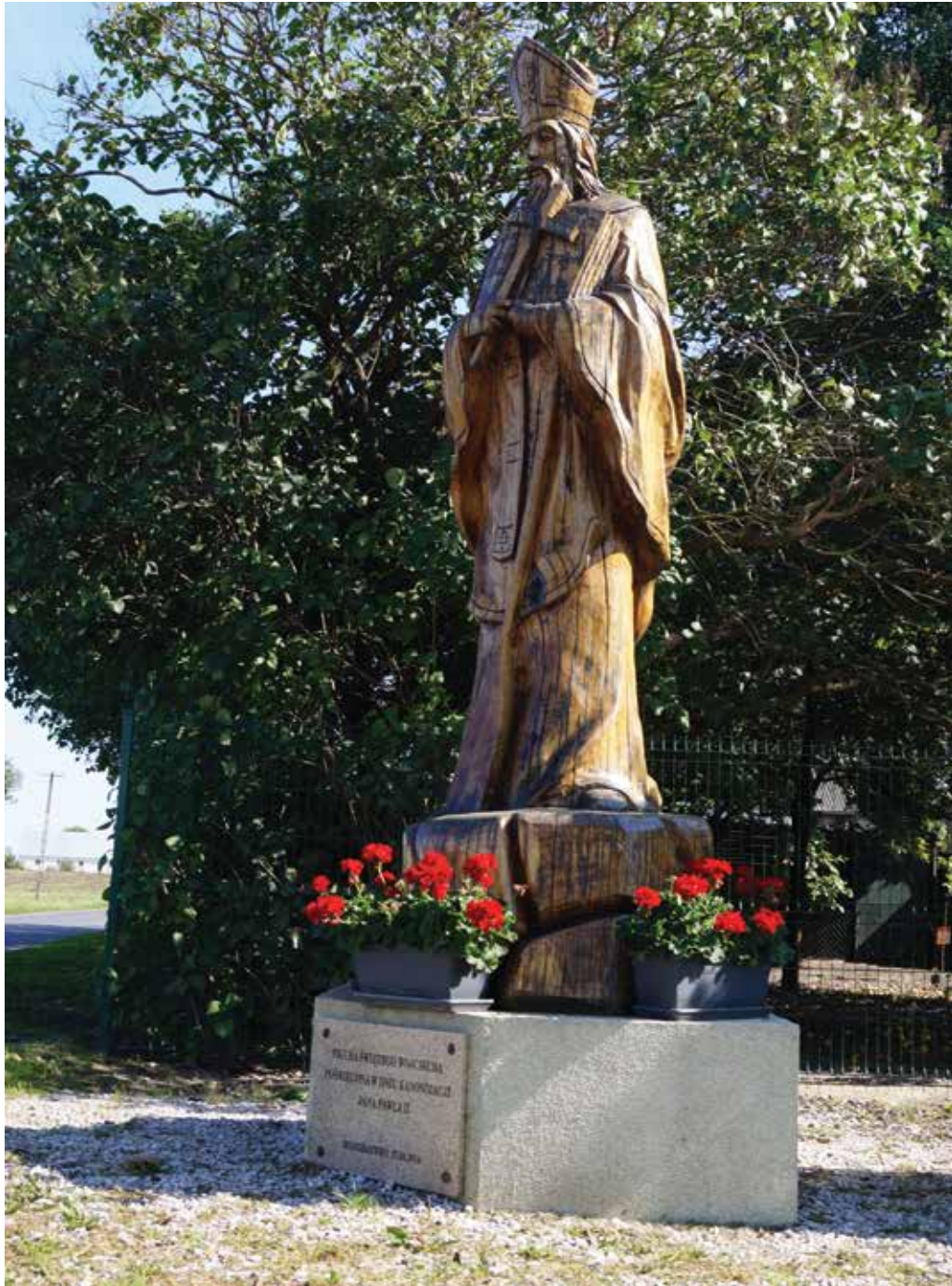
▲ Rzeźba św. Wojciecha w Budziejewku