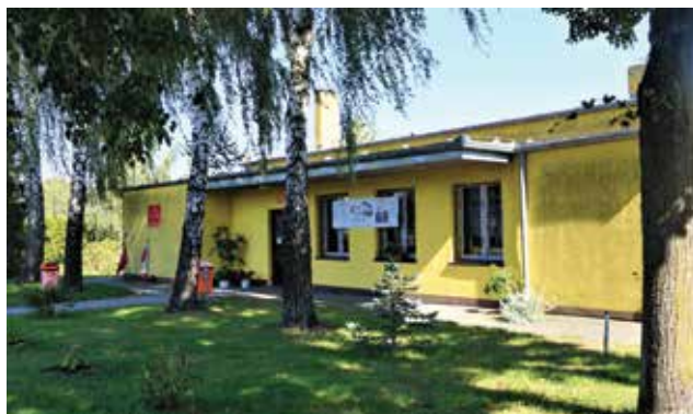
▲ Świetlica wiejska

Popowo Kościelne posiada miejscowy plan zagospodarowania. W rejonie dróg powiatowych są tereny pod zabudowę mieszkaniową jednorodzinną, działki budowlane sprzedają gmina i osoby prywatne.