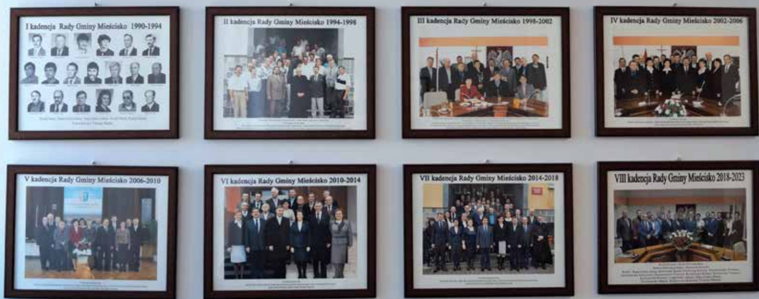
▲ Galeria Rad Gminy w sali sesyjnej