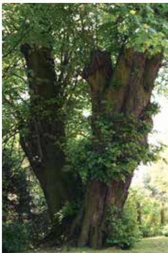
▲ Podwójna lipa przy kościele w Popowie Kościelnym