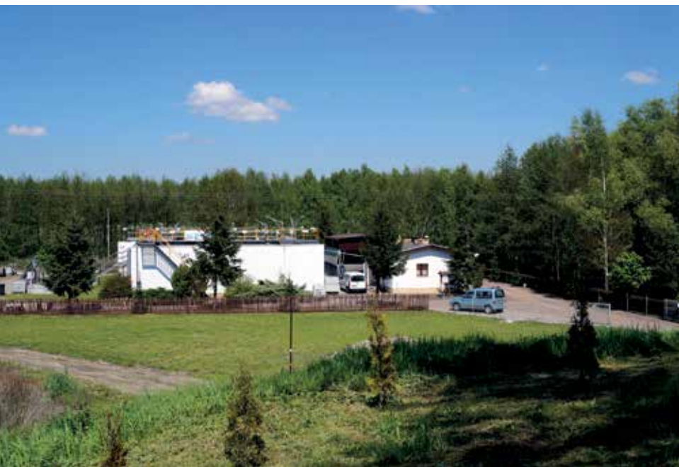
▲ Oczyszczalnia ścieków w Mieścisku