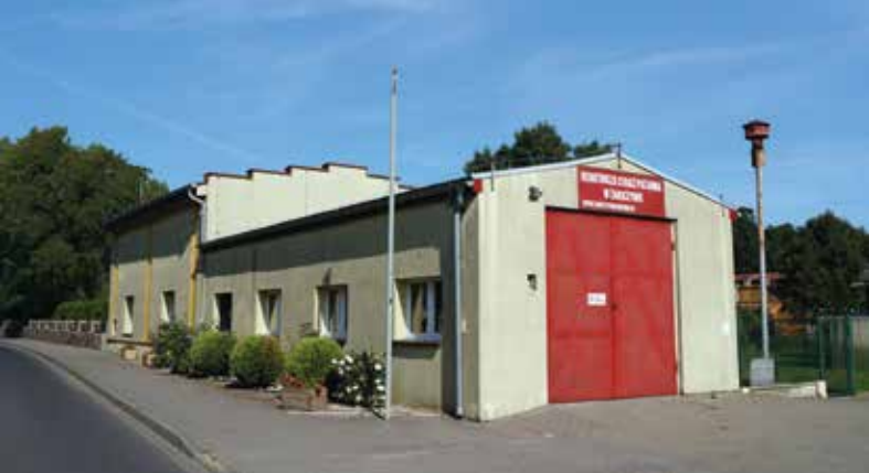
▲ Remiza i świetlica wiejska

Rolniczych, członek Koła Naukowego Poznańskiego i Toruńskiego. Majątek ten był stale wydzierżawiany. Obszar dworski wynosił ponad 600 ha. Większe kompleksy pól miały swoje nazwy: Staw, Graniczki, Wyręba, Lasek Suchy, Jezioro. Drogę z Żabiczyna, która w lesie rozchodziła się do Mirkowic, Mirkowiczek i Zakrzewa nazywano „Przybyłówką”.