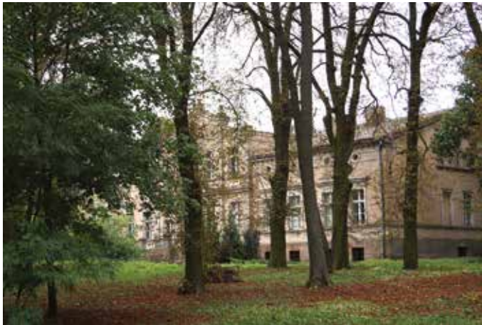
◀ Pałac świadczy o tym, że w dawnych czasach Zbietka była znaczącą miejscowością