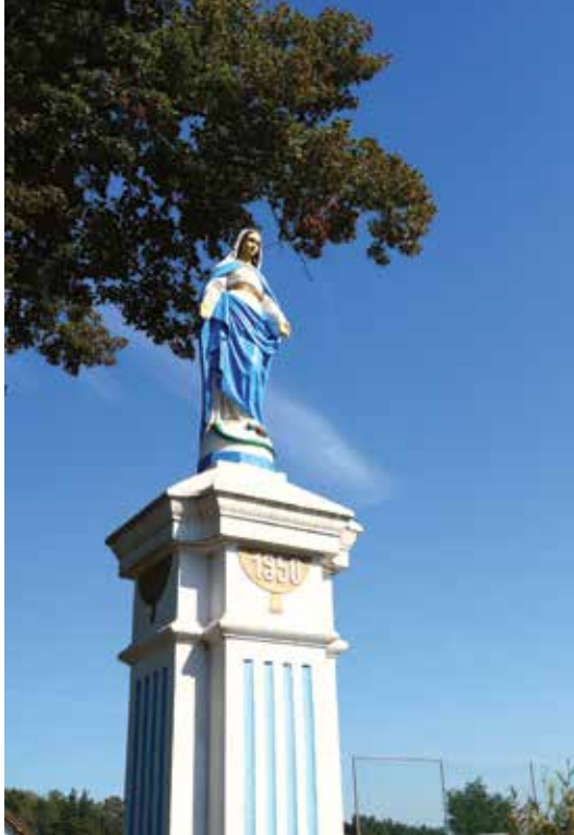
▲ Figura Matki Bożej z 1950 r.