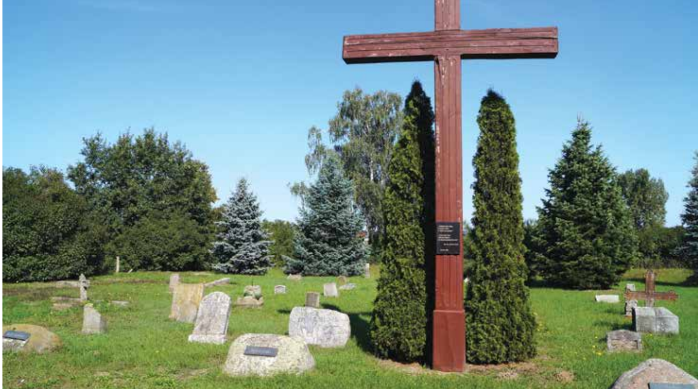
▲ Wyjątkowym miejscem, świadczącym o szacunku dla byłych mieszkańców tej ziemi, jest lapidarium w Mieścisku, gdzie zgromadzono pomniki ze wszystkich starych cmentarzy ewangelickich w gminie.