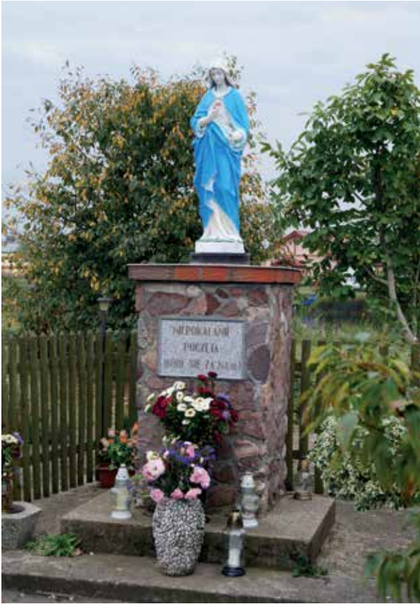
▲ Figura Matki Bożej

Wieś liczy ponad 250 mieszkańców. Zajmuje dość rozległy teren, gdyż jej zabudowa ma luźny charakter. Za centrum uważa się zabudowania położone w pobliżu dawnego dworu. W tej części jest sklep, stoi świetlica wiejska z salą posiadającą zaplecze kuchenne, obok znajduje się ładny plac zabaw dla dzieci. Kilka lat temu cały ten obiekt „przeszedł” modernizację, dzięki czemu stał się bardziej funkcjonalny, a ponadto prezentuje się okazale.