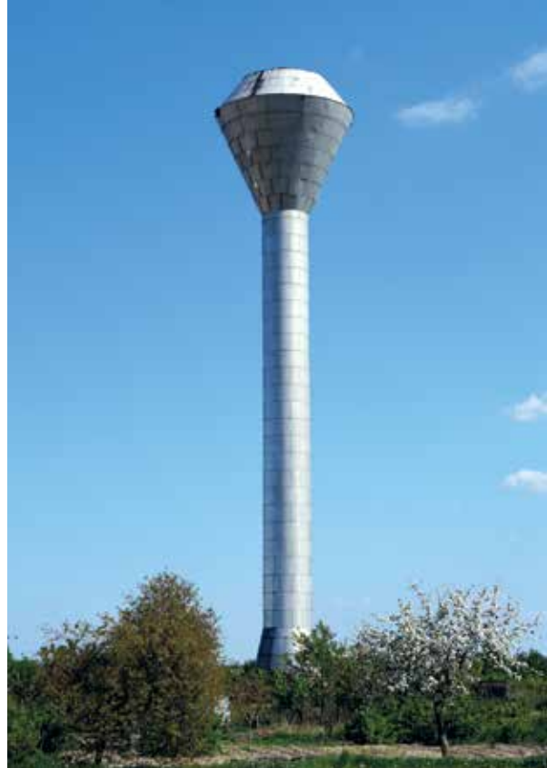
▲ Wieża ciśień

NOVATEK GREEN ENERGY – i wybudowano sieć gazową w Mieścisku, do której podłączono budynki użyteczności publicznej i zakłady pracy. W celu zmniejszenia emisji gazów na terenie gminy systematycznie wykonywane są prace związane z termomodernizacją budynków użyteczności publicznej oraz budową i modernizacją lokalnych dróg dojazdowych. Dobrymi działaniami, które udało się zrealizować, było wprowadzanie nowego systemu zagospodarowania odpadów komunalnych oraz utworzenie przez władze gminne Punktu Selektywnej Zbiórki Odpadów Komunalnych w Popowie Kościelnym. Realizowany jest również szereg projektów, w ramach których, podnoszona jest systematycznie wiedza mieszkańców w zakresie mądrego i odpowiedzialnego gospodarowania odpadami. Mieszkańcy we własnym zakresie zakładają kolektory słoneczne oraz budują sukcesywnie przydomowe oczyszczalnie ścieków.