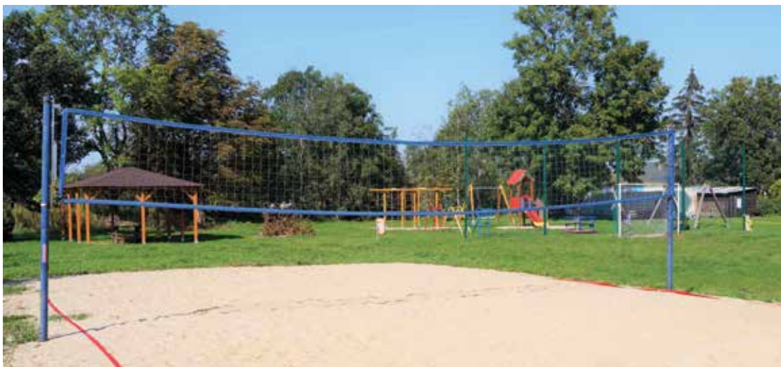
▲ Wiata, boisko i plac zabaw dla dzieci