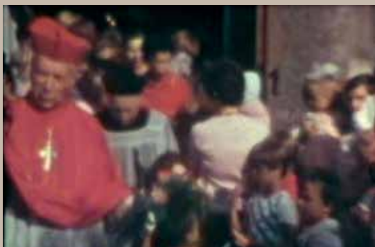
▲ Wizyta Prymasa Polski ks. kard. Stefana Wyszyńskiego była w Mieścisku wielkim wydarzeniem

Historia tych ziem jest bardzo bogata. Odkryto tu około tysięcy stanowisk archeologicznych z różnych epok. Najstarszymi śladami bytności człowieka w tym rejonie (okolice Mieściska i Popowa Kościelnego; Mirkowiczki – wioska łowców reniferów) są pochodzące sprzed ok. 12 tys. lat pozostałości po miejscach obozowania ludności mezołitycznej. Pierwsze wzmianki o wielu miejscowościach wchodzących obecnie w skład gminy zaczęły pojawiać się w różnych XIV-wiecznych źródłach. Najstarsze udokumentowanie ma natomiast wieś Żabiczyn, która jest wymieniona w 1216 r.