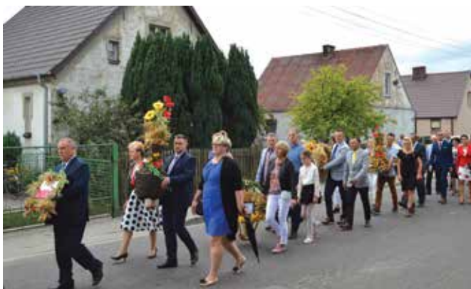
▲ Korowód z wieńcami dożynkowymi

wyniósł nieco ponad 303 tysiące złotych, z czego dofinansowanie unijne to ponad 170 tysięcy, a reszta stanowiła wkład własny gminy.