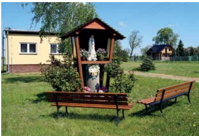
▲ Kapliczka, a za nią świetlica wiejska