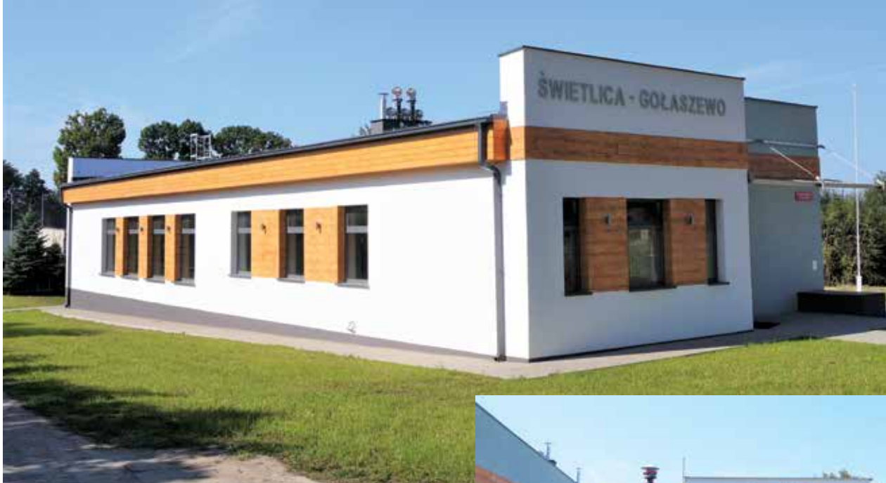
▲ Nowa świetlica Nowa świetlica została wyróżniona w ogólnopolskim konkursie "Modernizacja i budowa XXI wieku"