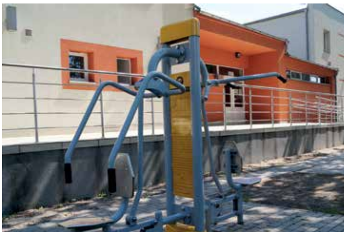
▲ Siłownia na wolnym powietrzu

W okresie międzywojennym Mieścisko utrwaliło pozycję centralnego ośrodka dla okolicznych miejscowości. Nie zmieniło tego nawet odebranie mu w 1934 roku praw miejskich, gdyż niejako w zamian zostało stolicą dużej gminy zbiorczej, która obejmowała 28 wsi i osad.