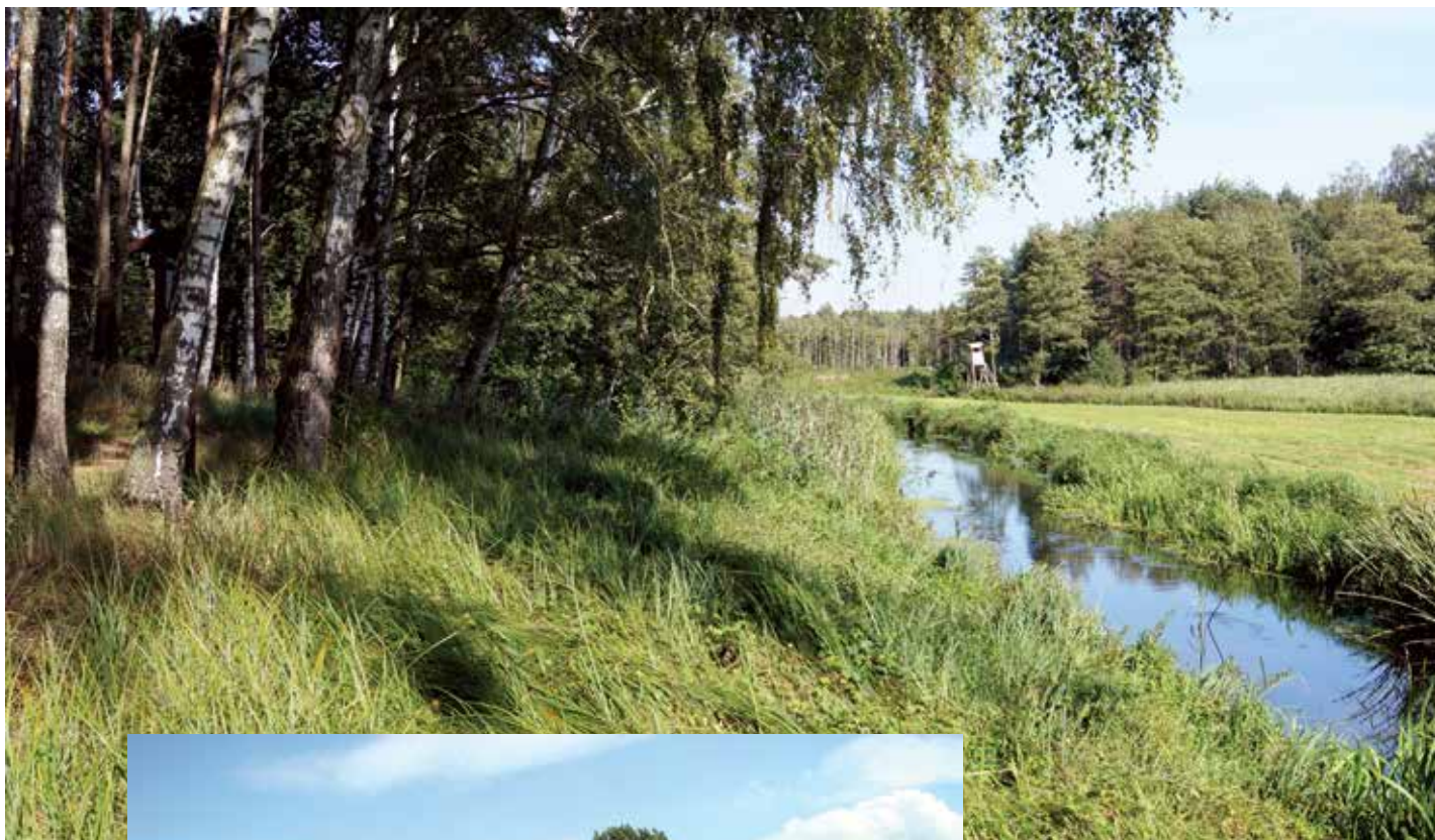
▲ Rzeka Wełna