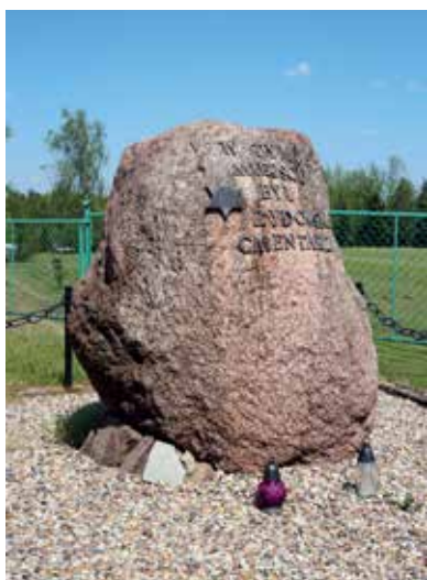
▲ Obelisk na miejscu dawnego cmentarza żydowskiego w Mieścisku