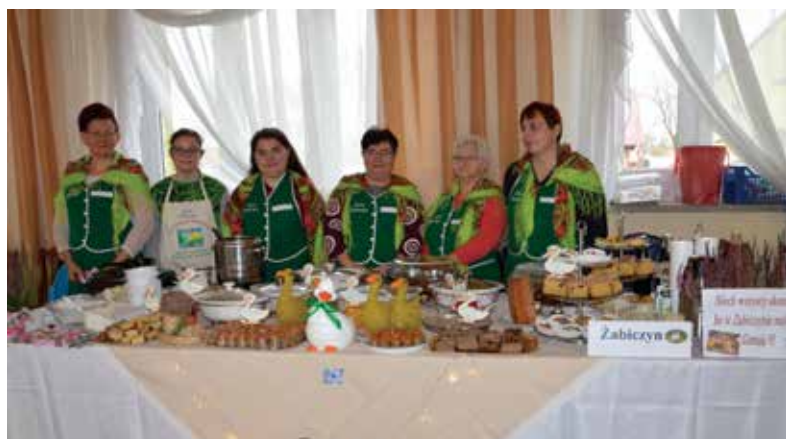
◀ Festiwal Smaków to naprawdę doskonała okazja skosztowania smakołyków