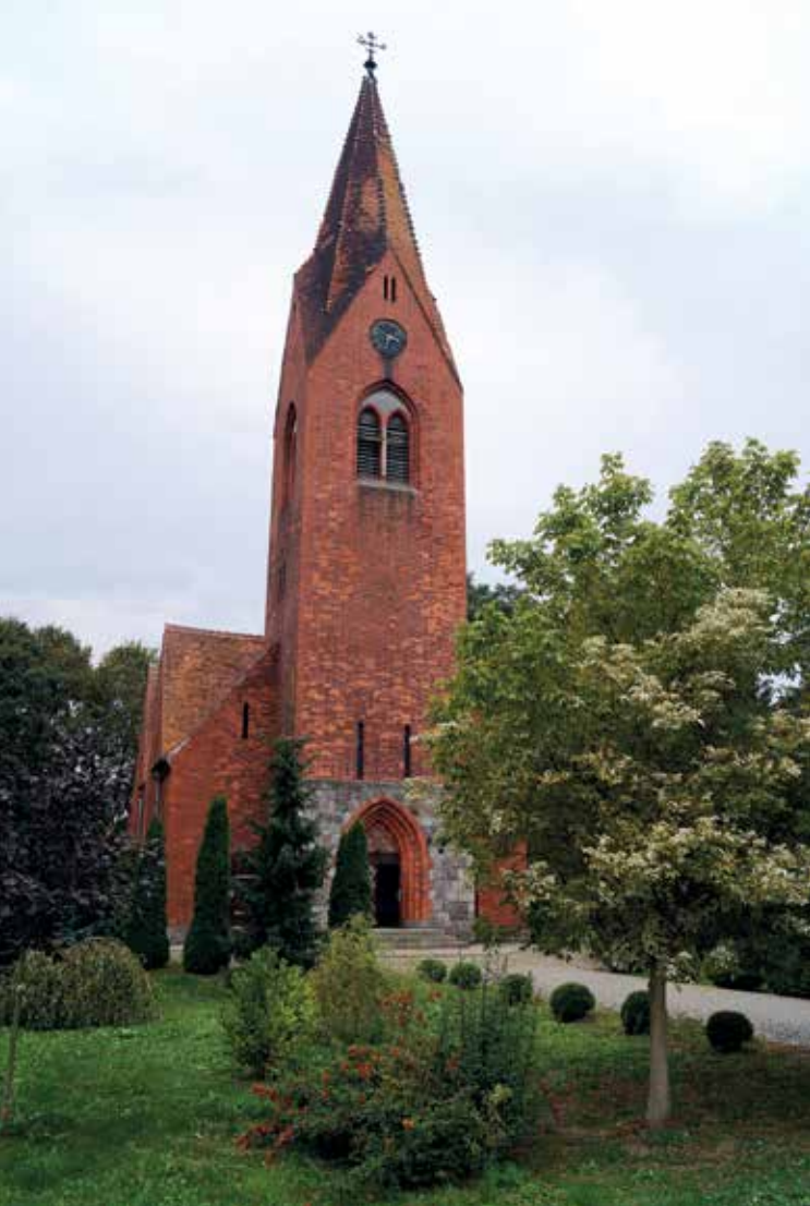
▲ Kościół pw. Matki Bożej Bolesnej

Obecnie wieś liczy 300 mieszkańców. Istnieje tu 56 gospodarstw rolnych. Rolnicy gospodarują na dobrych glebach.