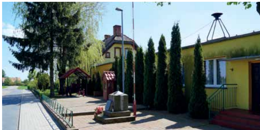
▲ Świetlica i remiza