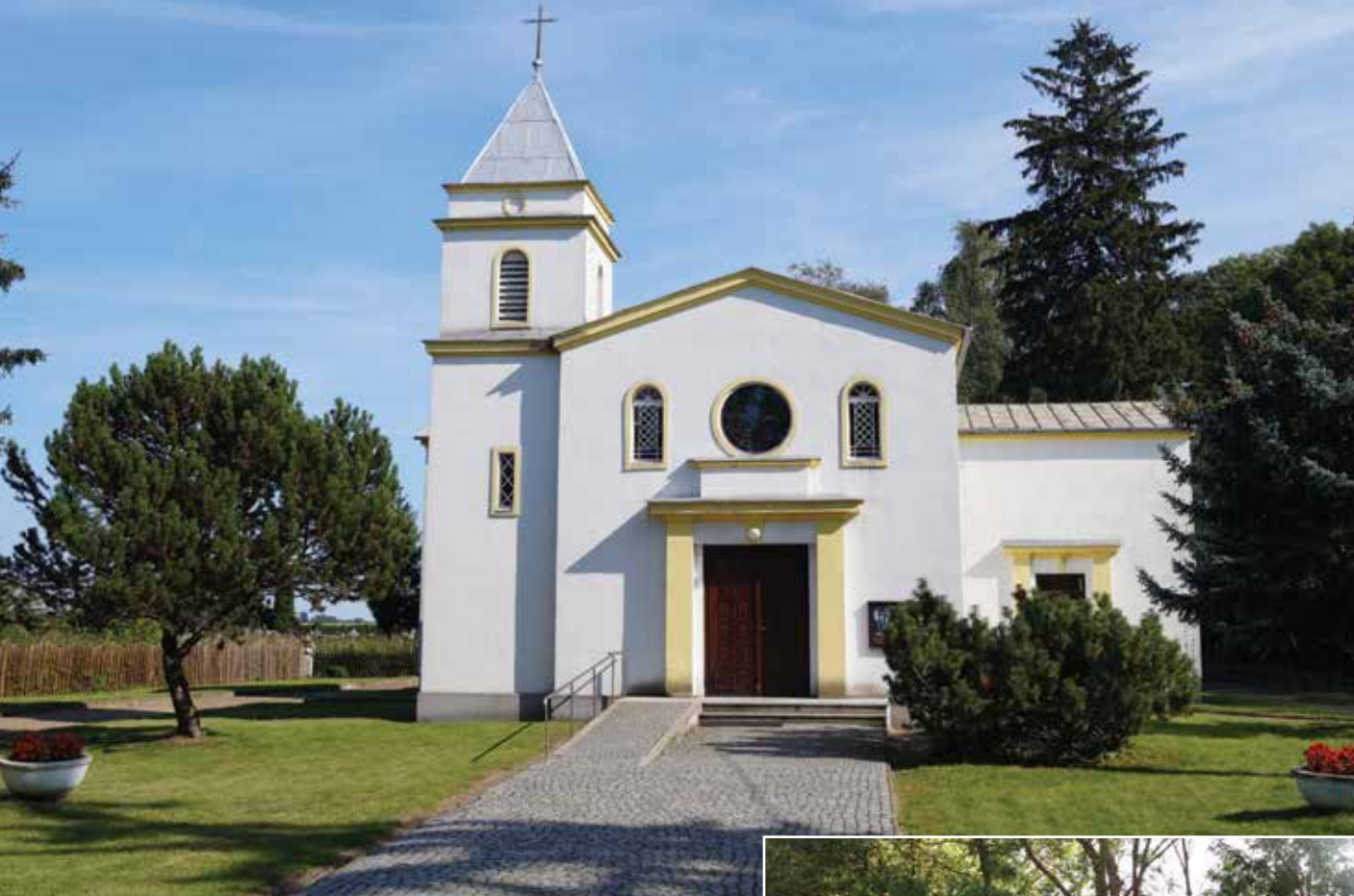
▲ Kościół Żabiczynie