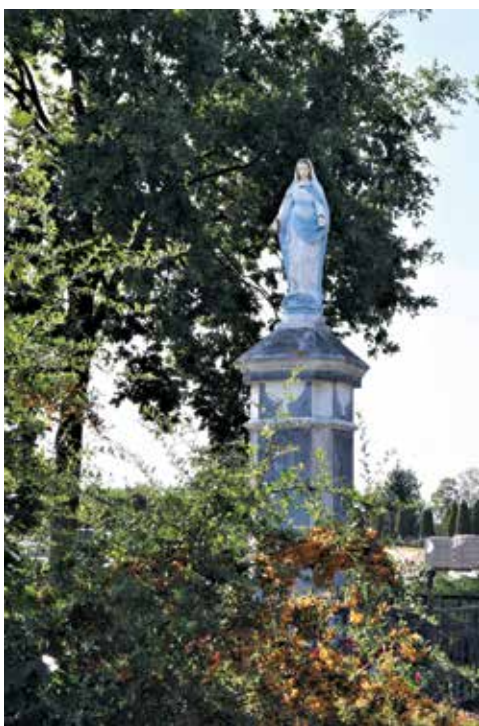
▲ Figura Matki Bożej stoi w centrum miejscowości od 1950 r.

W latach 1709, 1710 i 1851 w Mieścisku panowało morowe powietrze, którego ofiarą padło wielu mieszkańców.