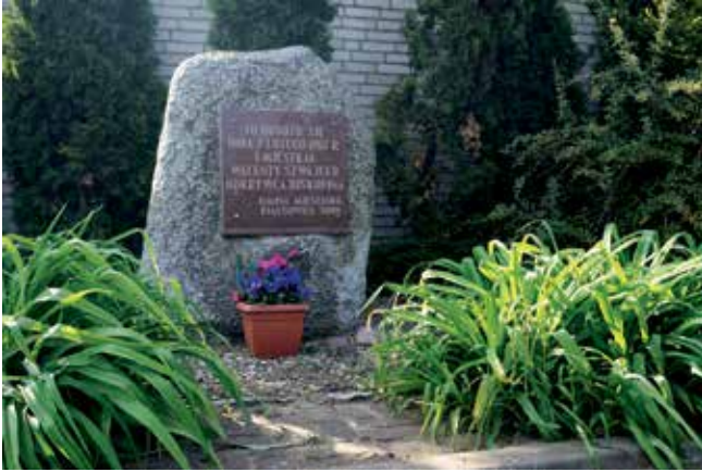
▲ Pamiątkowa tablica przy rodzinnym domu odkrywcy Biskupina