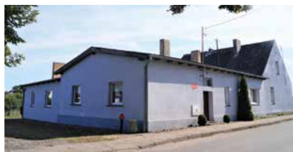
▲ Świetlica wiejska

Po wojnie na opuszczonych przez ludność niemiecką gospodarstwach osiedlili się osadnicy ze wschodnich terenów Polski, głównie z województwa łwowskiego. Obecnie sołectwo zamieszkuje ponad 80 osób. Istnieje tu 18 gospodarstw rolnych. Świetlica stoi w Mirkowicach.