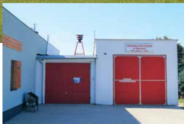
▲ Remiza OSP