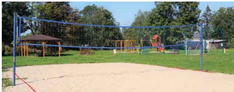
▲ Nowe boiska i plac zabaw w Wieli