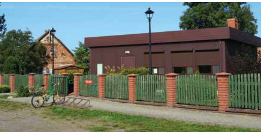
▲ Świetlica wiejska