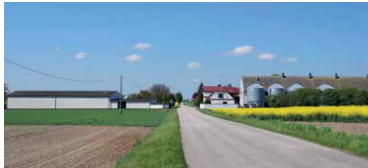
▲ Pląskowo silnym rolnictwem stoi

Jest to mała, licząca niepełna 90 mieszkańców i 17 domów wieś, położona na południowym krańcu gminy. Wyróżnia się tym, że prawie pod każdym numerem jest tu gospodarstwo rolne. Pierwsze wzmianki o Pląskowie pochodzą z 1311 r. Przez kilka wieków było ono siedzibą Pląskowskich, herbu Oksza. W 1885 r. Pląskowo miało 147 mieszkańców i 17 domów, a Pląskówko 46 mieszkańców i 6 domów. W okresie międzywojennym sołectwo było znacznie większe niż obecnie - Pląskowo zamieszkiwało 150 osób (18 gospodarstw rolnych), a Pląskówko 48 (5 gospodarstw rolnych). Zdecydowanie dominowała ludność polska. Pod koniec lat 30. XX wieku Pląskówko zostało włączone do Pląskowa i odtąd była już jedna wieś. W Pląskowie istnieją 22 gospodarstwa rolne, wszystkie od pokoleń w rękach tych samych rodzin.