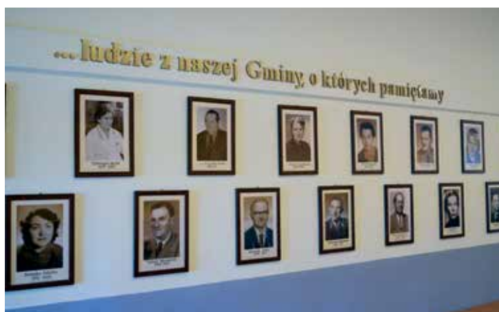
► Galeria zasłużonych w Domu Kultury