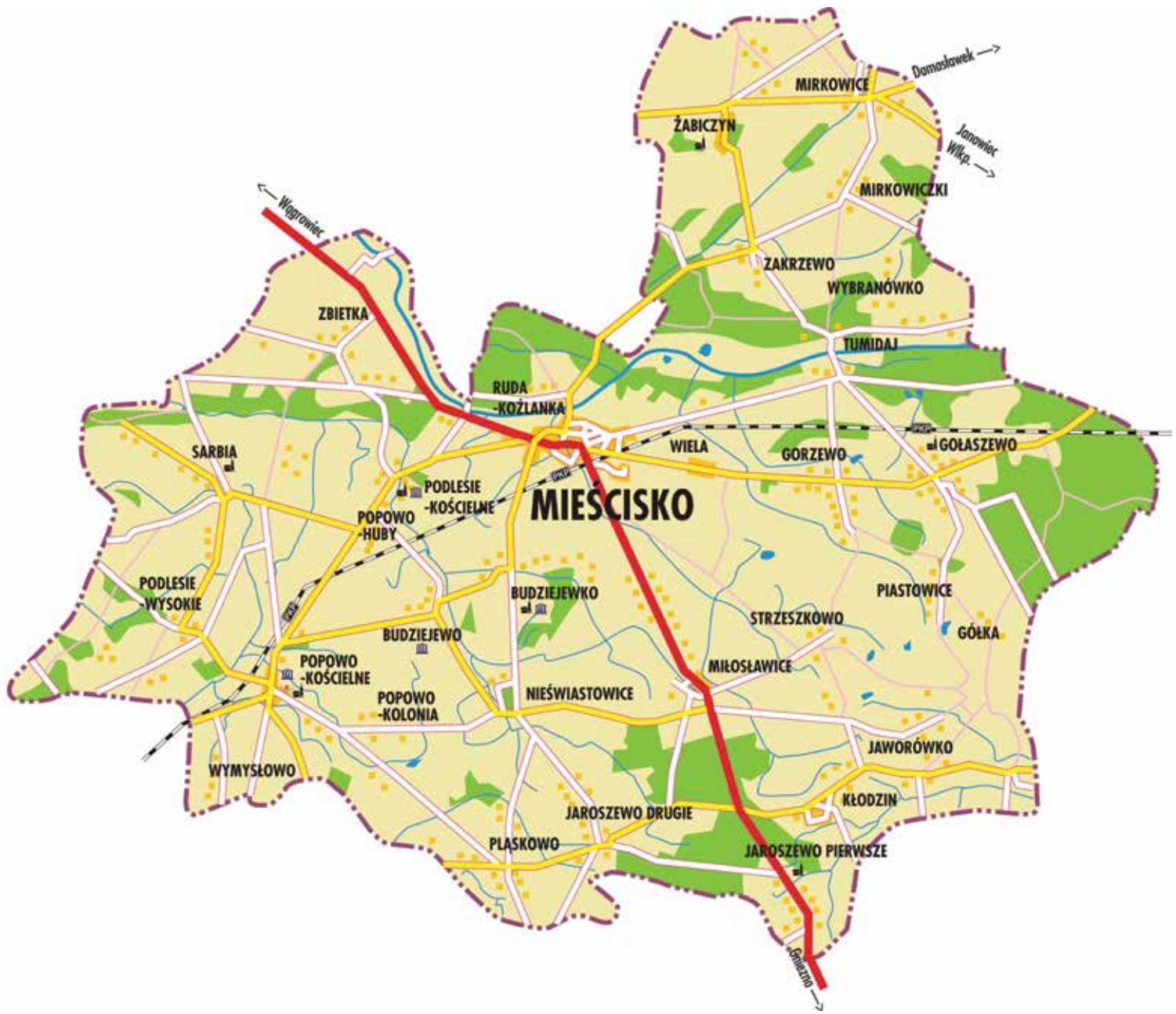
■ Lokalny przewodnik po Gminie Mieścisko ■