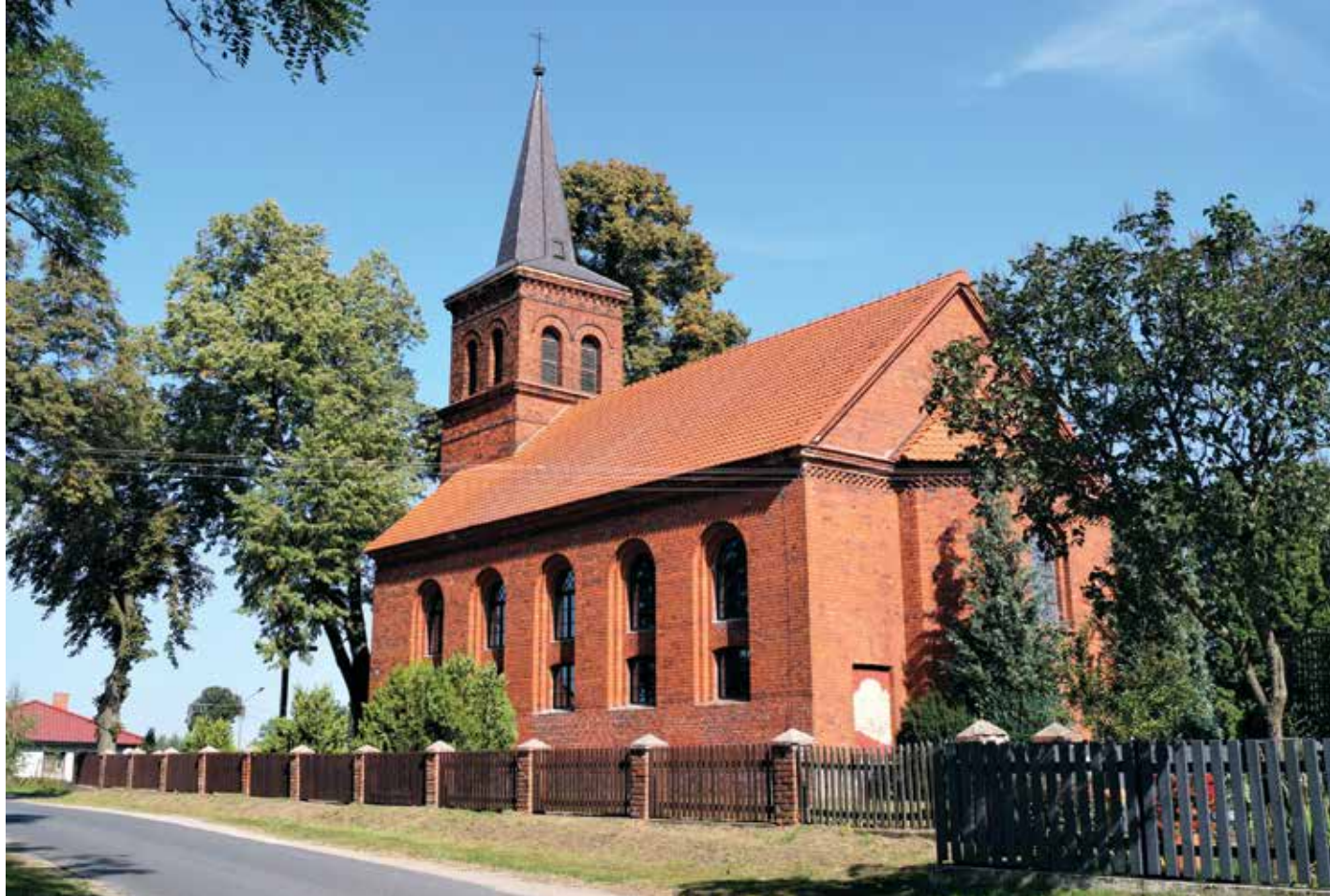
▲ Kościół pw. Św. Stanisława Biskupa Męczennika

Ewangelickiej tu mieszkających. W 150 rocznicę wybudowania przez nich kościoła. Rzymsko-katolicka Parafia Gołaszewo”.