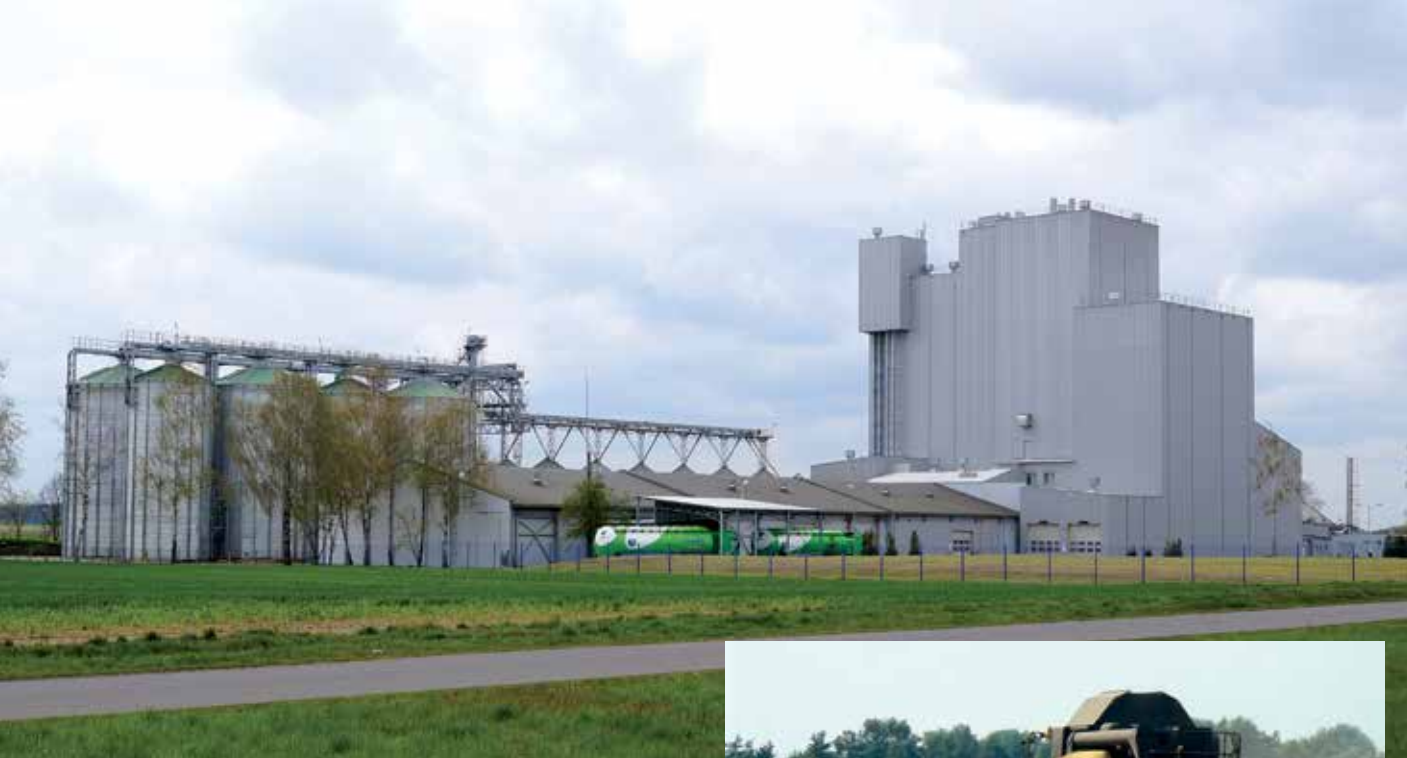
▲ Zakłady De Heus