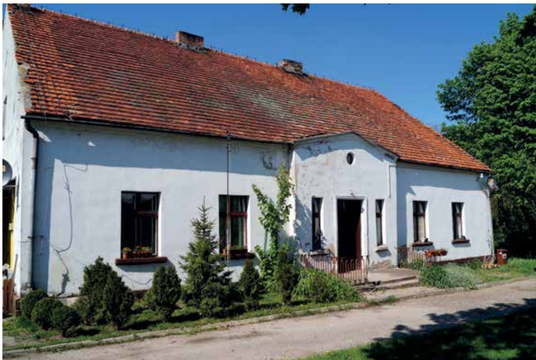
▲ Dwór, w którym dawniej mieszkał zarządca folwarku