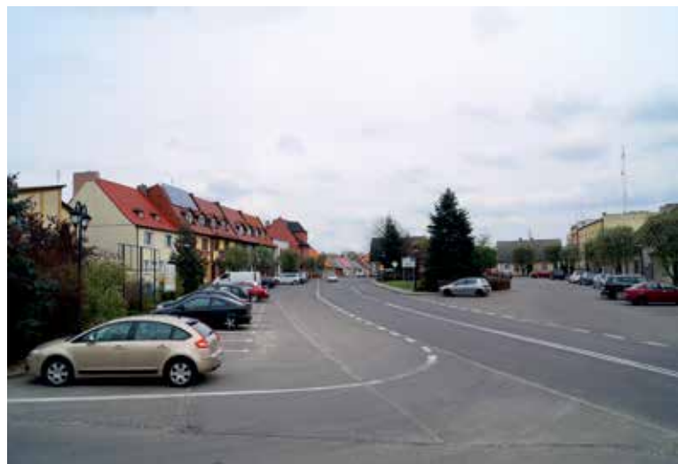
▲ Centrum Mieściska wyznacza pl. Powstańców Wielkopolskich