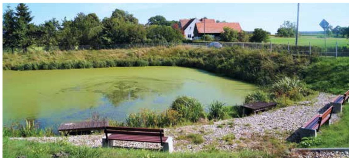
▲ Malowniczy staw w środku wsi został urządzony dzięki funduszom PZU oraz środkom z programu Wielkopolska Odnowa Wsi