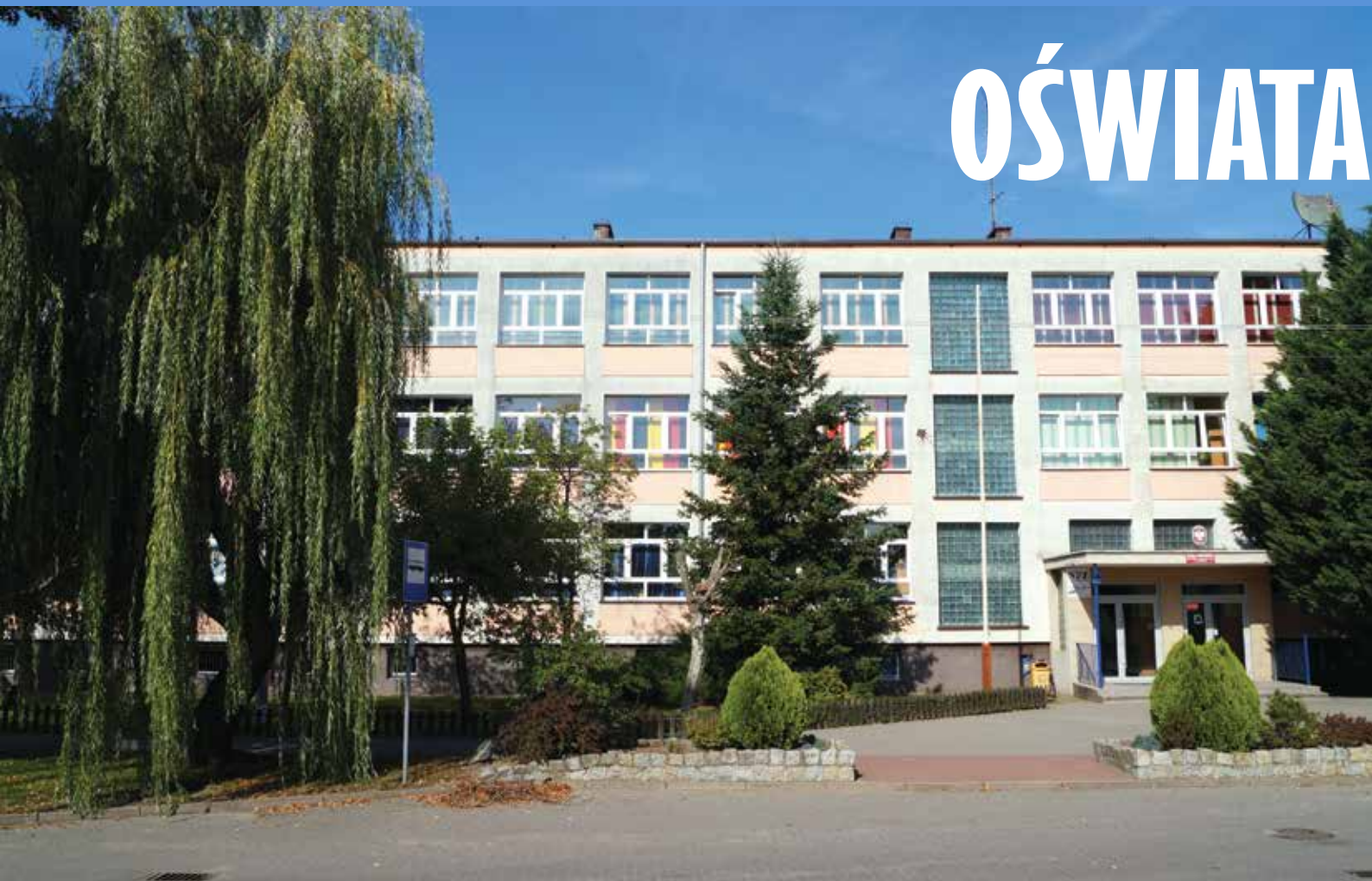
▲ Szkoła Podstawowa w Mieścisku