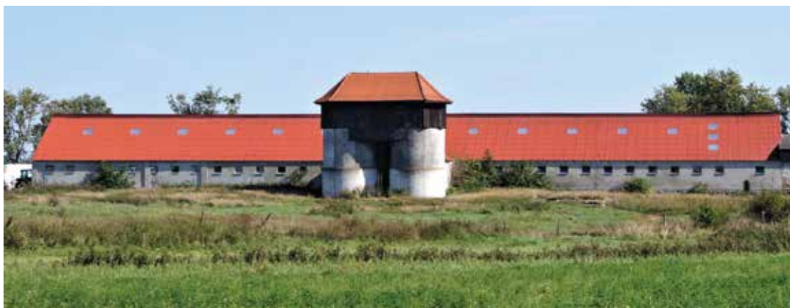
▲ Obora z XIX wieku nadal spełnia swoją funkcję i imponuje wielkością