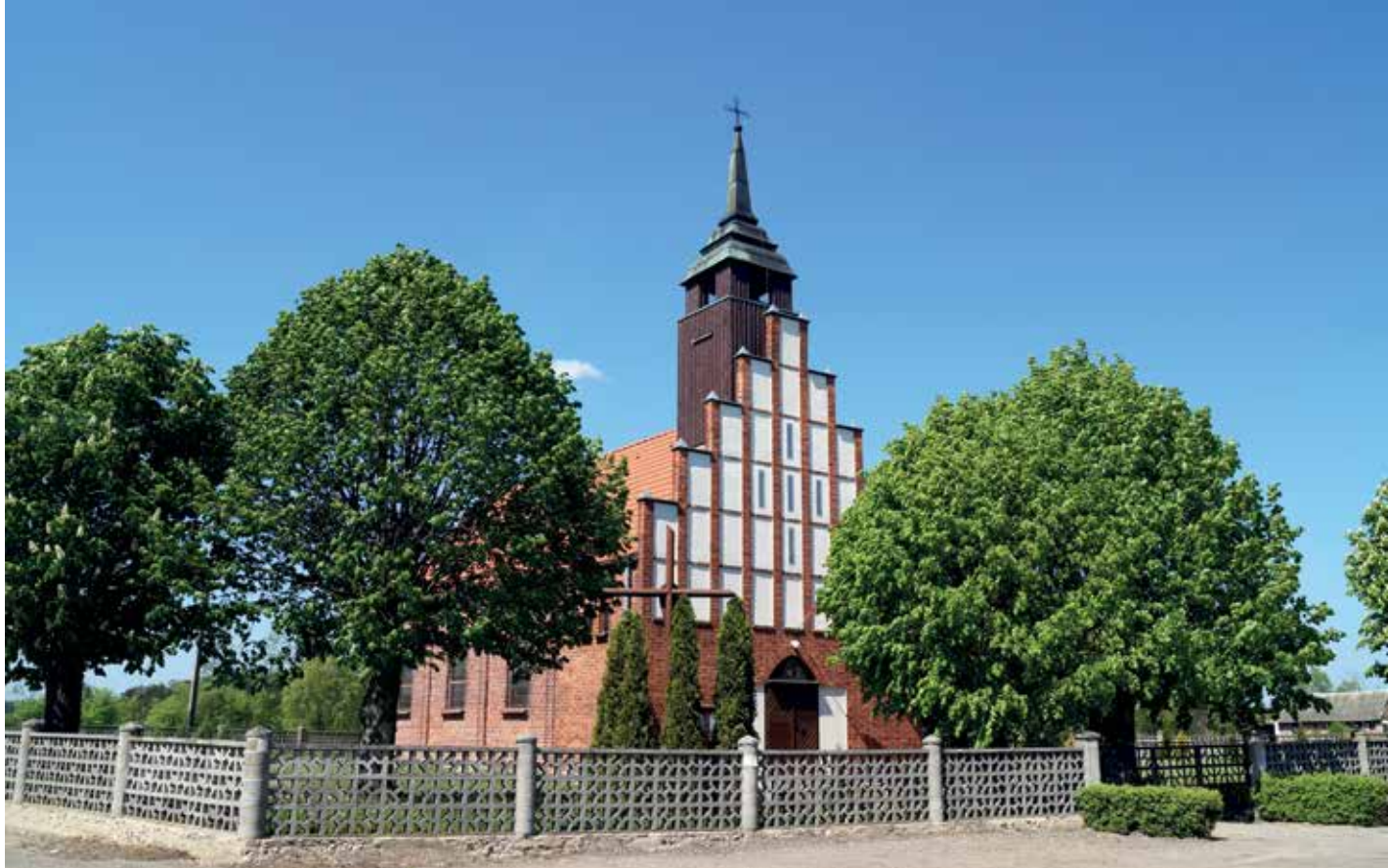
▲ Kościół pw. św. Kazimierza