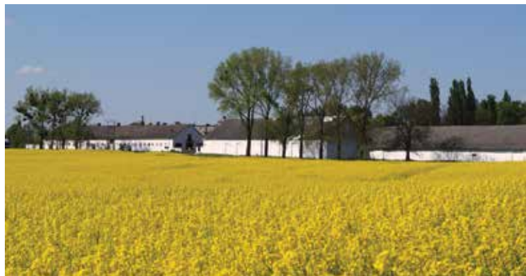
▲ Widok na budynki gospodarcze dawnego folwarku