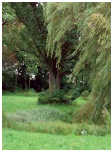
▲ Drzewa w parku w Żabiczynie