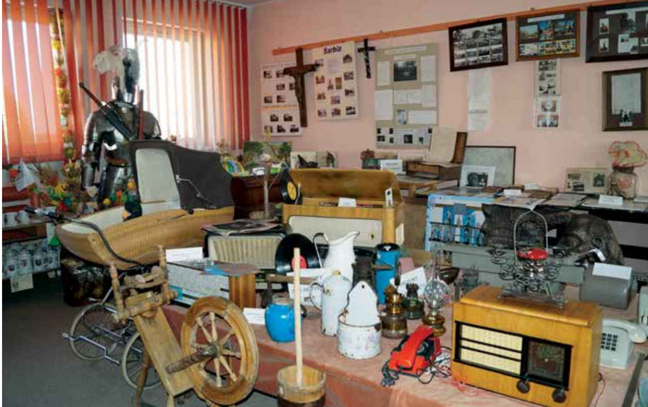
▲ Ekspozycje zgromadzone w Regionalnym Centrum Tradycji

Nieopodal tego wyjątkowego kamienia w 2018 roku utworzony został Park Pamięci, o której piszemy szerzej w dalszej części albumu.