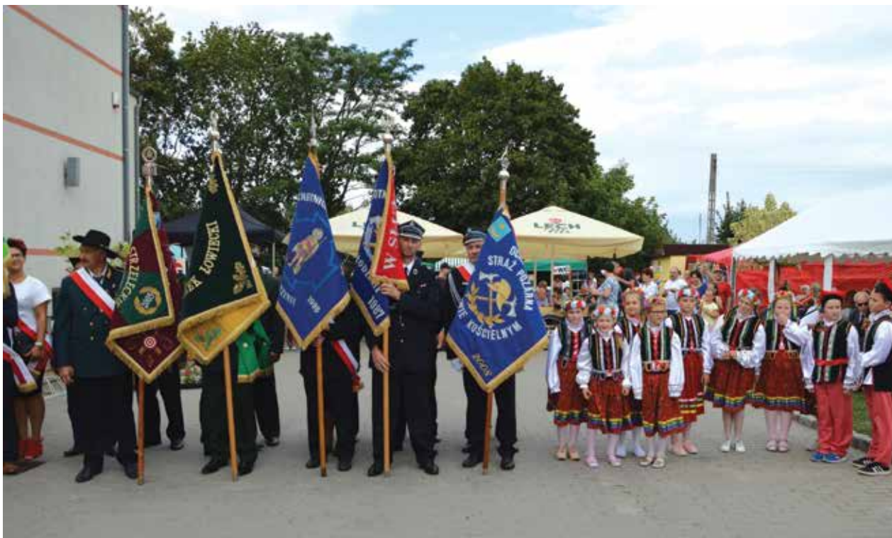
▲ Poczty sztandarowe Związku Strzeleckiego, Kola Łowieckiego oraz OSP

120-letnią tradycją szczyci się Kurkowe Bractwo Strzeleckie, które w 2001 r. reaktywowało działalność. Organizacja ta posiada w Popowie Kościelnym dom bracki oraz strzelnicę.