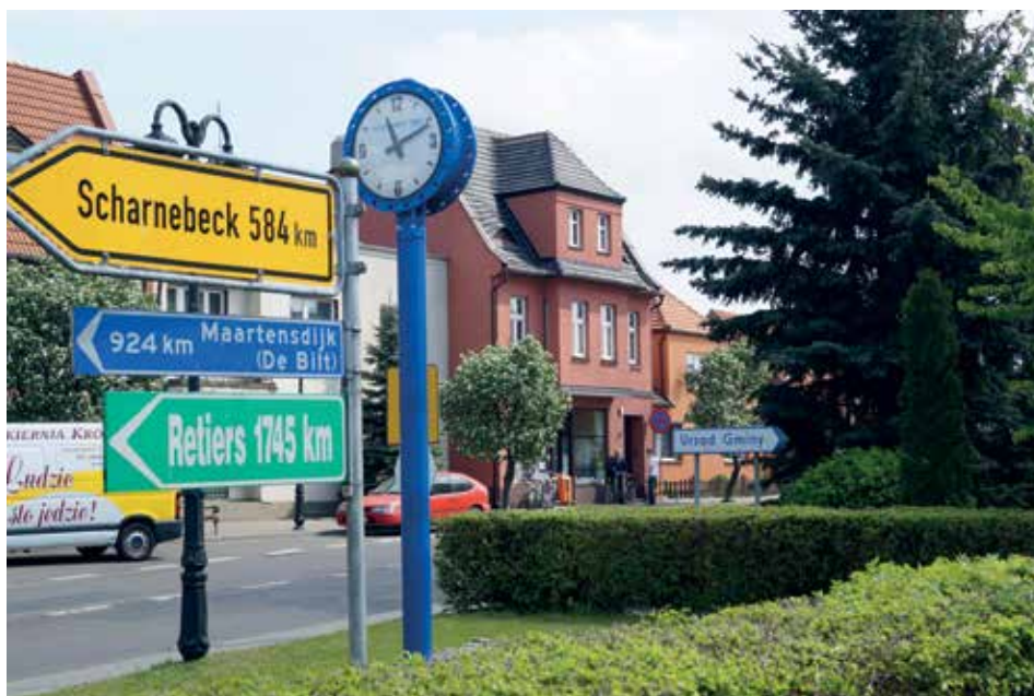
▲ Drogowskazy do zaprzyjaźnionych gmin zagranicznych