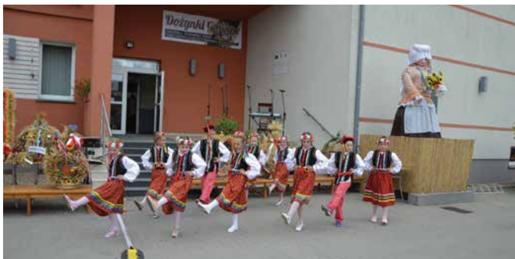
▲ Zespół „Jarzębinki”

Dzięki staraniom władz samorządowych wszystkie wsie sołeckie posiadają wyremontowane i dobrze wyposażone świetlice.