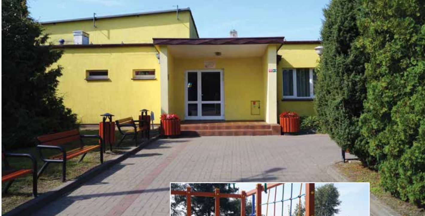
▲ Świetlica wiejska

Sarbia posiada świetlicę wiejską, w której mieści się sala na 150 osób z dobrze wyposażonym zapleczem kuchennym. Tu odbywają się największe w całej okolicy wesela.