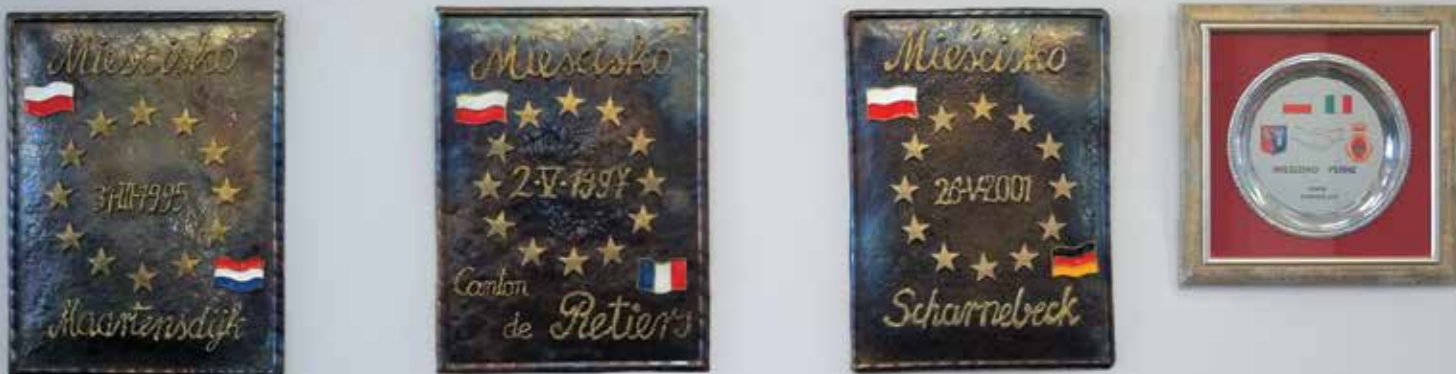
▲ Tabliczki upamiętniające nawiązanie partnerskich kontaktów