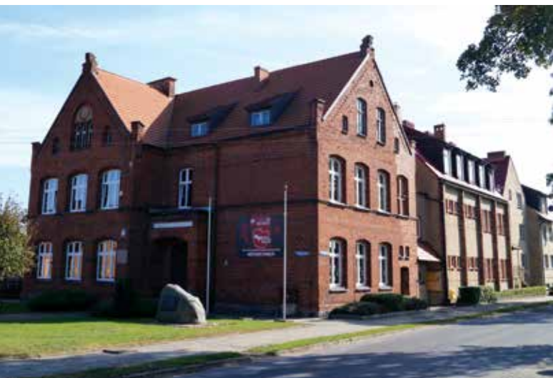
▲ Przedszkole i Szkoła Podstawowa klasy I – III w Miejsku