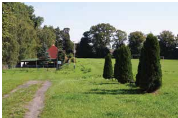
▲ Strzelnica Bractwa Kurkowego