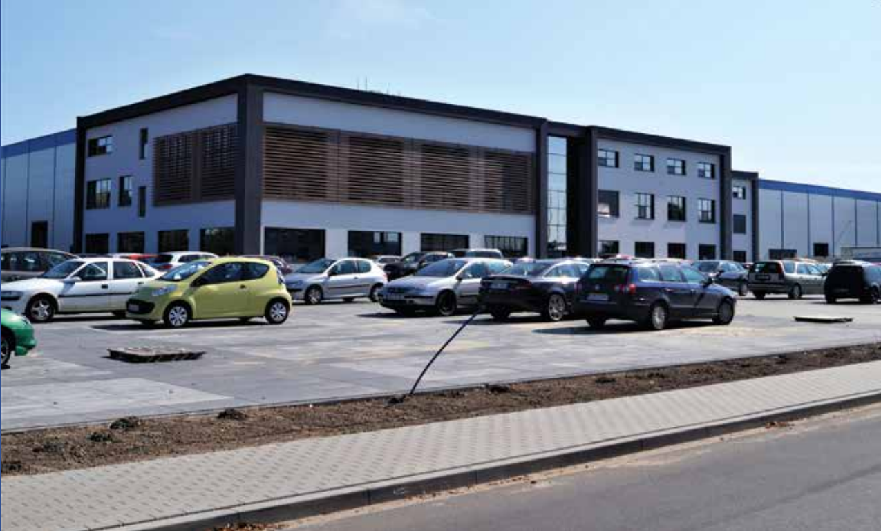
▲ Nowa hala produkcyjna „Serpól-Cosmetics”

Gospodarka na terenie gminy bardzo długo opierała się na rolnictwie. Do II wojny światowej istniało tu kilkanaście majątków dworskich, wśród których największe to: Mieścisko (1133 ha), Żabiczyn (608 ha), Nieświatowice (544 ha), Gorzewo (515 ha), Popowo Kościelne (500 ha), Zbietka (425 ha), Podlesie Kościelne (416 ha). Po nacjonalizacji na ich bazie w Mieścisku, Nieświatowicach, Podlesiu Kościelnym i Żabiczynie powstały zakłady państwowych gospodarstw rolnych, które wchodziły w skład Przedsiębiorstwa PGR w Popowie Kościelnym o obszarze 8277 ha.