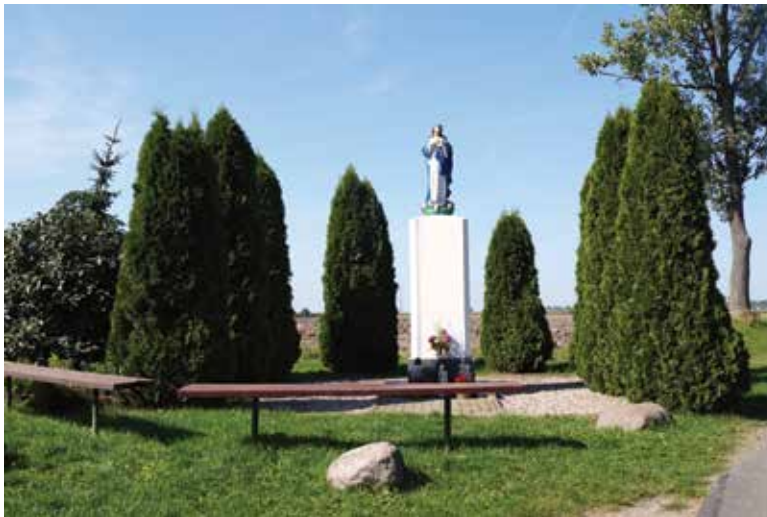
▲ Kapliczka z figurą Matki Bożej

Jest to jedna z nielicznych wsi, która prawie w całości zachowała swój pierwotny charakter i układ. Składa się z dwóch, położonych blisko siebie części. Pierwszą tworzą stare czworaki, usytuowane po obu stronach wąskiej drogi. Druga, położona w pobliżu uroczego stawu, to zabudowania dawnego folwarku, z których zachowały się obiekty gospodarcze, m.in. duża obora. Brakuje tam