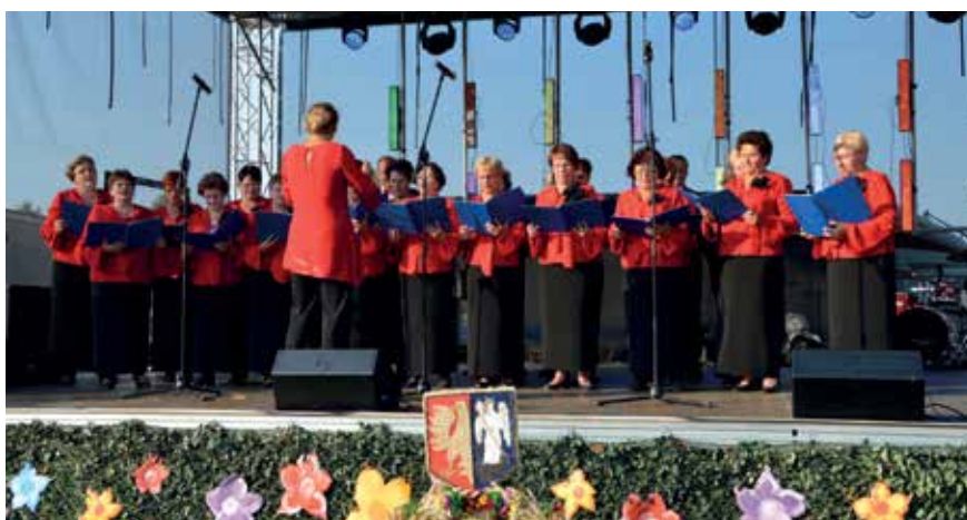
► Chór „Kanon”

Zespół ośrodka kultury współpracuje ze wszystkimi podmiotami życia społecznego (samorząd, stowarzyszenia, koła gospodyń wiejskich, sołectwa, szkoły, kościoły), gospodarczego (biznes), kulturalnego (zespoły artystyczne, powiatowe i wojewódzkie instytucje kultury). Imprezy kulturalne realizuje w sali widowiskowej ośrodka, ale także w licznych świetlicach i w plenerach. Wykorzystując wszechstronnie nowe media do realizacji podstawowej misji, prowadzi intensywną działalność w Internecie (kanały promocyjno-informacyjne, tematyczne podcasty, transmisje wydarzeń, spotkań). Podkreślając wartość wszechstronnej edukacji, prowadzi warsztaty muzyczne (chóry, orkiestra młodzieżowa), -taneczne (zespół mażorettek), filmowe, plastyczne, fotograficzne, teatralne, kluby seniora (edukacja ustawiczna), warsztaty artystyczne.