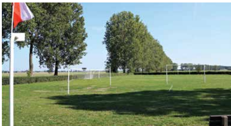
▲ Boisko i nowy plac zabaw