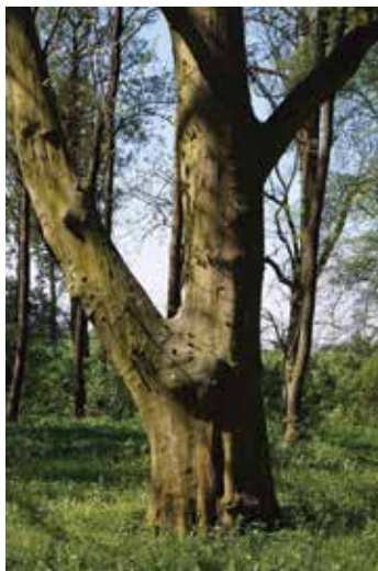
▲ Pomnikowy płatan w parku w Nieświastowicach