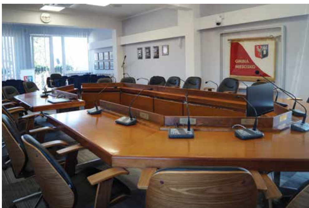
▲ Sala sesyjna w UG Mieścisko