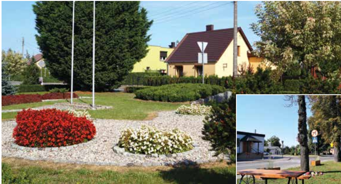
▲ Skwery w centrum Miejska są oznaką dbałości o estetykę