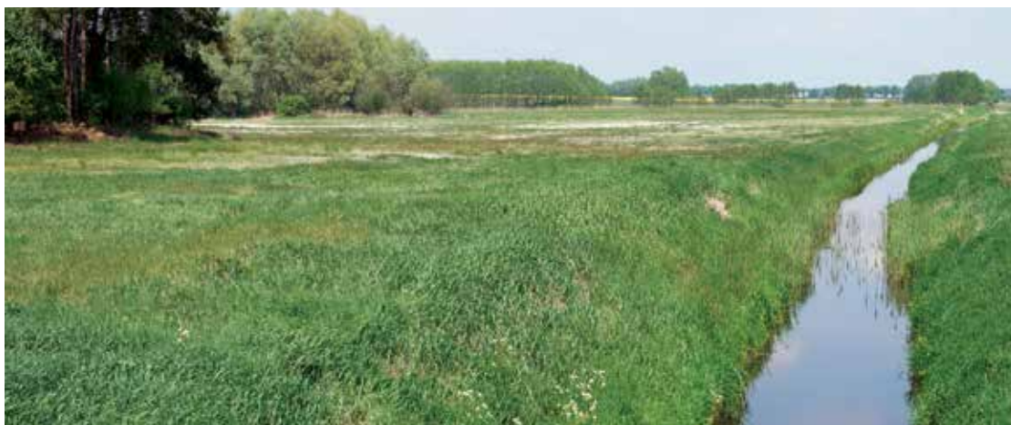
▲ Kanał w pobliżu Popowa Kościelnego

W rejestrze Wojewódzkiego Konserwatora Zabytków figurują trzy pomniki przyrody. Są to: 1. lipa szerokolistna o obwodzie na wysokości pierśnicy 340 cm – rosnąca przy kościele w miejscowości Popowo Kościelne, 2. lipa szerokolistna – o podwójnym pniu, o obwodach na wys. pierśnicy 420 i 405 cm, rosnąca przy kościele w miejscowości Popowo Kościelne, 3. gład (czerwony granit) – kamień św. Wojciecha o obwodzie 20,5 m usytuowany 300 m od kościoła w Budziejewku.