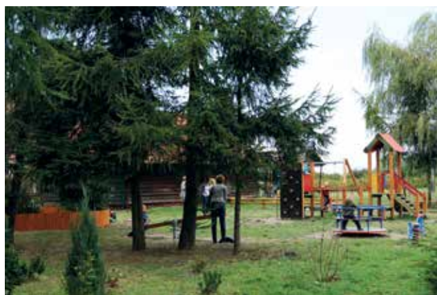
▲ W przedszkolu „Mali Odkrywcy”