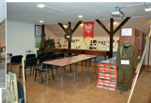
▲ Po reformie szkolnictwa budynek po gimnazjum został przeznaczony na Instytut Pamięci oraz Klub Seniora