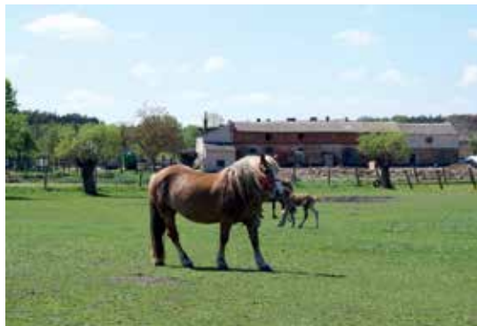
▲ Konie rasy zimnokrwistej

We wsi działają Ochotnicza Straż Pożarna i Koło Gospodyń Wiejskich. Organizacje i tutejsi mieszkańcy mają do dyspozycji świetlicę i remizę, które mieszczą się w tym samym obiekcie – dawnej szkole.