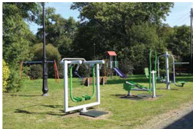
▲ Siłownia zewnętrzna i plac zabaw