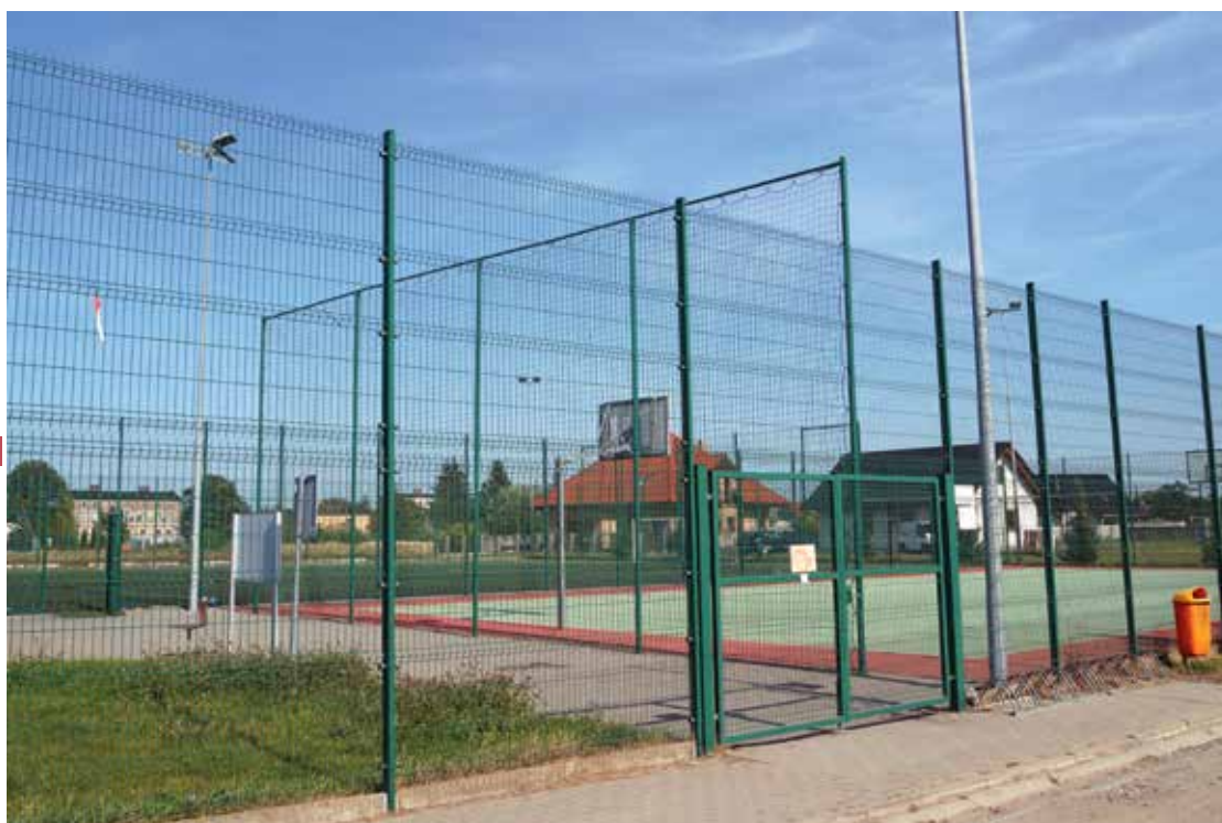
▲ Kompleks boisk sportowych „Orlik” w Miejsku