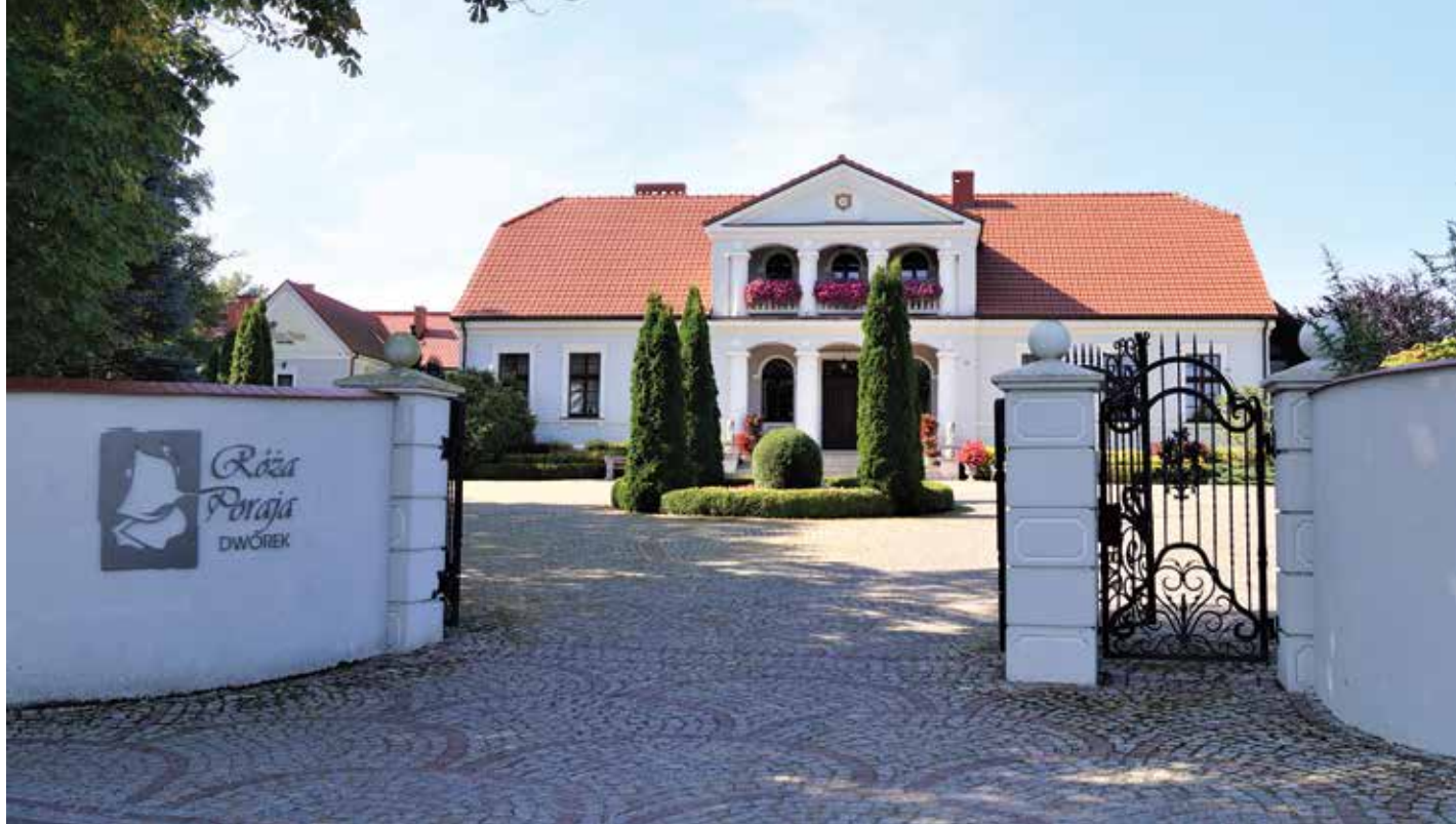
▲ Dworek „Róża Poraja” i jego otoczenie tworzą jedno z najpiękniejszych miejsc nie tylko w gminie, ale i w powiecie wągrowieckim