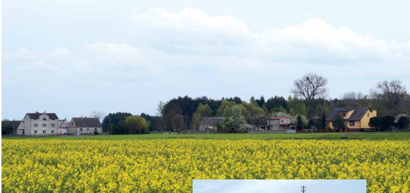
▲ Zabudowa wsi