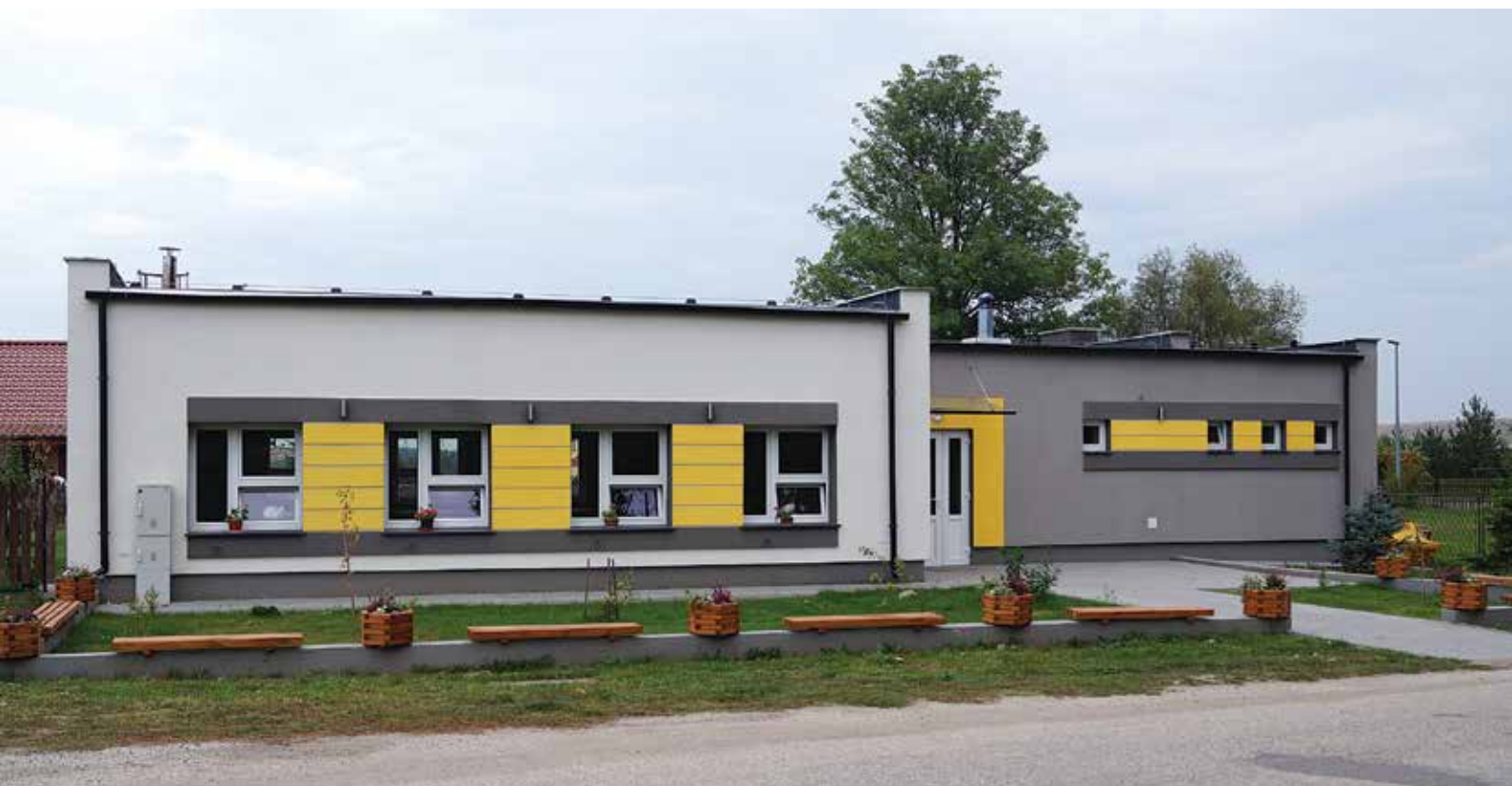
▲ Świetlica wiejska w Zbietce

był przewodniczącym Powiatowej Rady Ludowej. W 1932 r. rozparcelował część swojego majątku i utworzył na nim 20 gospodarstw.