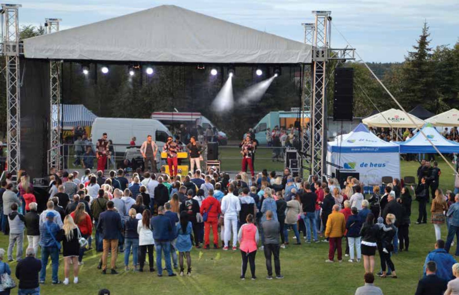
▲ Targi Michałowskie zawsze mają niepowtarzalną atmosferę