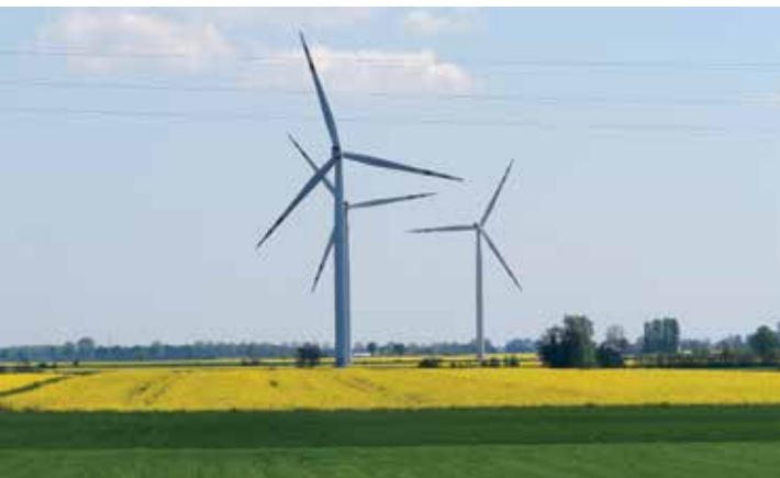
▲ W krajobrazie Kłodzina pojawiły się elektrownie wiatrowe