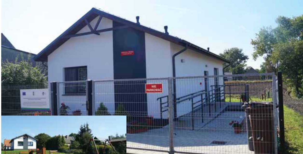
▲ Nowa świetlica