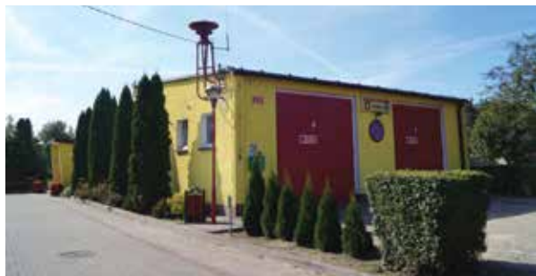
▲ Remiza OSP