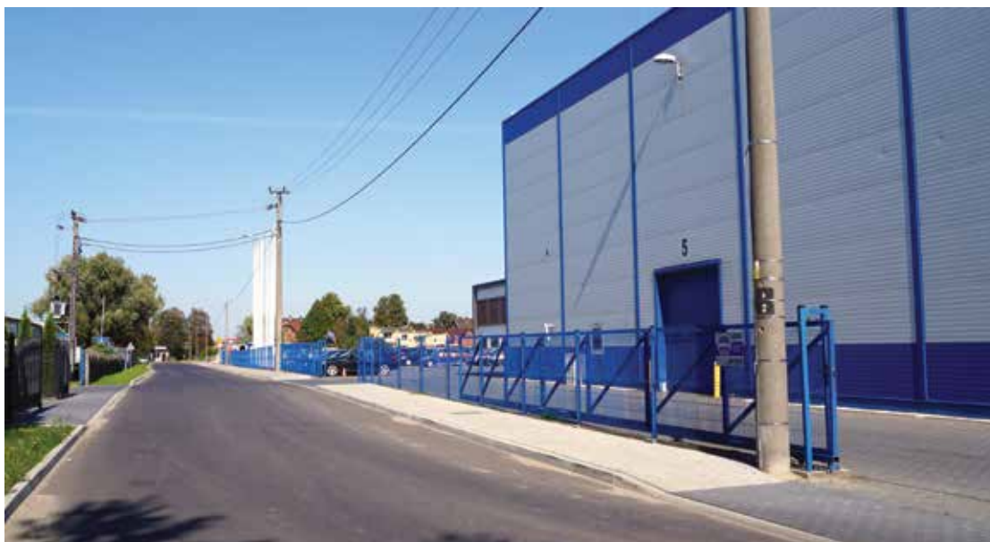
▲ Gmina w miarę możliwości inwestuje w drogi i ulice