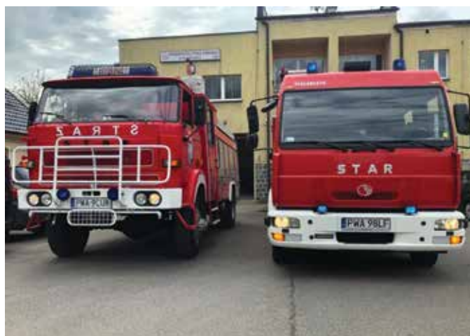
▲ Wozy bojowe OSP w Mieścisku

Na terenie gminy znajduje się 6 parafii i 8 kościołów katolickich. Siedziby parafii znajdują się w Budziejewku, Gołaszewie, Mieścisku, Popowie Kościelnym, Sarbii i Żabiczynie.