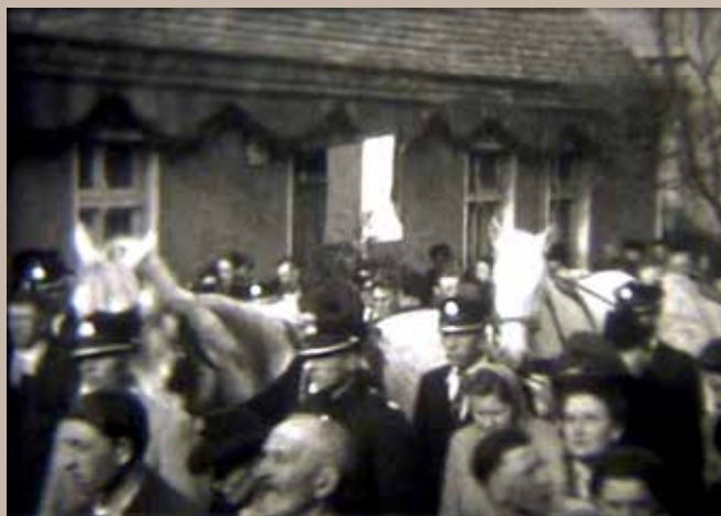
▲ Po odzyskaniu niepodległości miejscowe Koło Towarzystwa Przyjaciół Żołnierza doprowadziło do sprowadzenia zwłok obywateli gminy Mieścisko, którzy w 1939 r. stracili życie pod Kłeckiem i Gnieznem. Szczątki 14 poległych złożone w 7 trumnach (po dwóch w jednej) przywieziono w sobotę przed Niedzielą Palmową na rynek, gdzie były wystawione w honorowej asyście. Na drugi dzień odbył się manifestacyjny pogrzeb. Trumny złożono we wspólnym grobie na miejscowym cmentarzu. W 1946 r. zbudowano pomnik.

Wyjątkowym obiektem i dużą atrakcją turystyczną jest kamień św. Wojciecha w Budziejewku. Podobno w niedostrzegalny sposób głaz zapada się w ziemię, legenda głosi, że kiedy skryje się cały i pamięć o nim zaginie, nastąpi koniec świata. Kamień (czerwony granit) od wieków