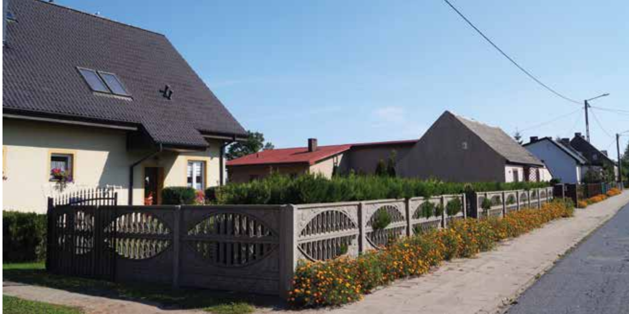
▲ Droga przez wieś