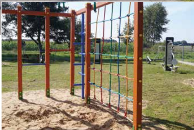
▲ Siłownia zewnętrzna i plac zabaw

Wiele dobrego można powiedzieć o tu-tejszej Ochotniczej Straży Pożarnej, do której należą druhowie z Sarbii i Podlesia Kościelnego. W jej strukturach działają drużyny młodzieżowe dziewcząt i chłopców. OSP posiada remizę wybudowaną w 1992 roku, a na wyposażeniu ma dwa wozy bojowe. Tradycje straży ogniowej sięgają 1900 r. Do współczesnych czasów zachował się m.in. zabytkowy wóz bojowy z sikawką z 1902 roku, który niedawno został odrestaurowany.