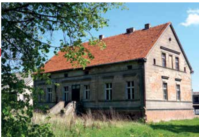
▲ Dwór w Jaworówku

Jaworówko jest wyjątkowe pod kilkoma względami: należy do trzech parafii (Gołaszewo, Mieścisko i Łopienno), ma tylko 43 mieszkańców i rozciąga się od Gółki aż do Miłosławic, czyli na odcinku prawie 3-kilometrowym.