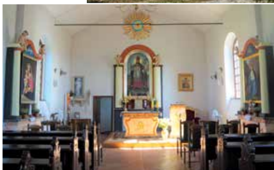
▲ Kościół św. Wojciecha z 1859 r. ma swój niepowtarzalny urok