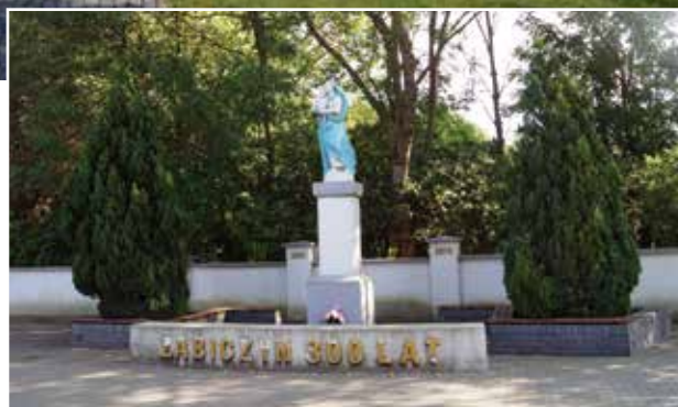
▲ Przed figurą Matki Bożej z dzieciątkiem ustawiono „jubileuszowy” murek