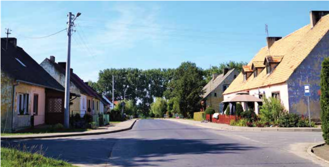
▲ Zachowała się dawna folwarczna zabudowa wsi