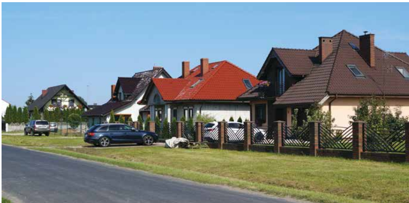
▲ W Mieścisku i innych miejscowościach gminy powstają liczne domy mieszkalne