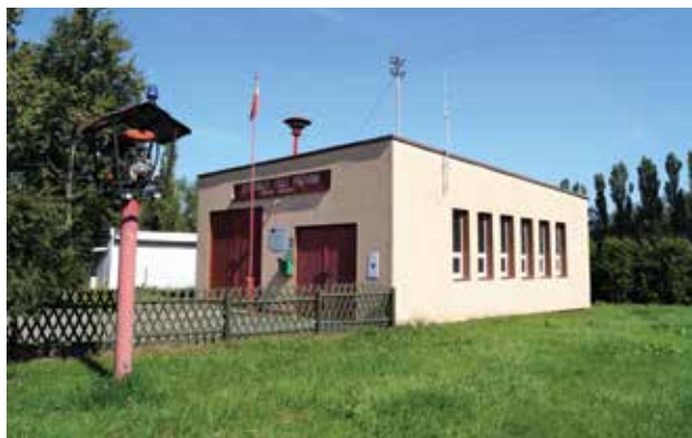
▲ Remiza OSP Popowo Kościelne