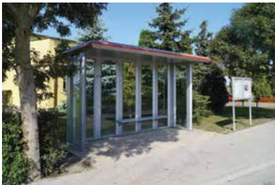
▲ Estetyczny przystanek autobusowy