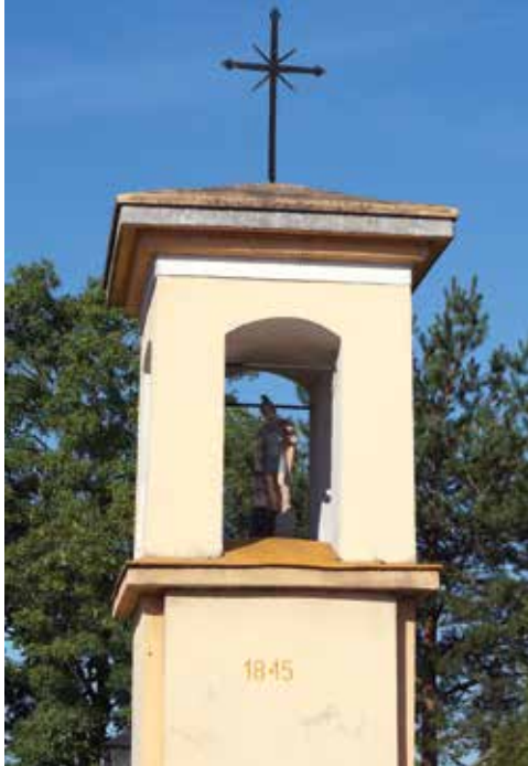
▲ Najstarsza w gminie kapliczka św. Floriana z 1845 r.