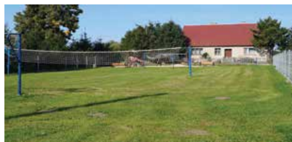
▲ Boisko i plac zabaw