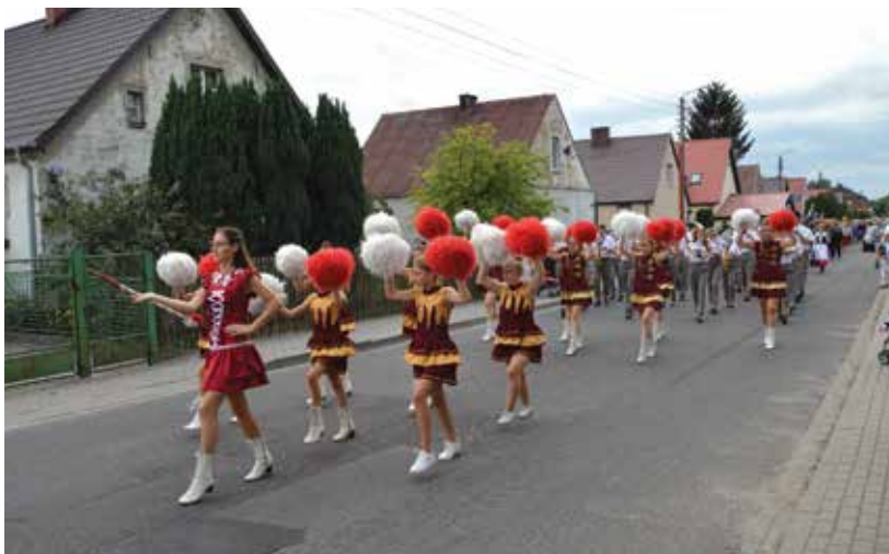
▲ Zespół mażorettek