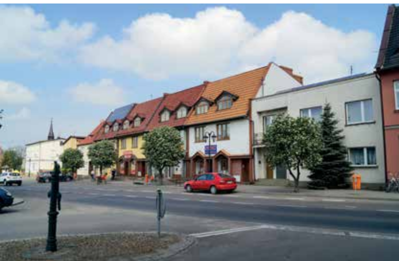
▲ Północna pierzeja głównego placu w Mieścisku