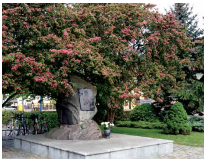
▲ „W hołdzie mieszkańcom Gminy Mieścisko, którzy oddali życie za Ojczyznę” – głosi napis na tym oryginalnym pomniku, stojącym naprzeciwko Urzędu Gminy