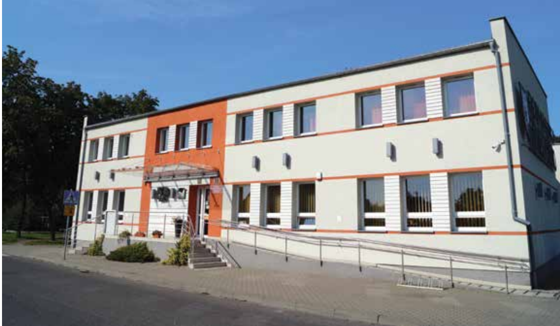
▲ Dom Kultury w Mieścisku

Zespół ośrodka kultury współpracuje ze wszystkimi podmiotami życia społecznego (samorząd, stowarzyszenia, koła gospodyń wiejskich, sołectwa, szkoły, kościoły), gospodarczego (biznes), kulturalnego (zespoły artystyczne, powiatowe i wojewódzkie instytucje kultury). Imprezy kulturalne realizuje w sali widowiskowej ośrodka, ale także w licznych świetlicach i w plenerach. Wykorzystując wszechstronnie nowe media do realizacji podstawowej misji, prowadzi intensywną działalność w Internecie (kanały promocyjno-informacyjne, tematyczne podcasty, transmisje wydarzeń, spotkań). Podkreślając wartość wszechstronnej edukacji, prowadzi warsztaty muzyczne (chóry, orkiestra młodzieżowa), -taneczne (zespół mażorettek), filmowe, plastyczne, fotograficzne, teatralne, kluby seniora (edukacja ustawiczna), warsztaty artystyczne.