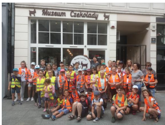
Przed Muzeum Czekolady w Poznaniu

W programie półkolonii znalazły się również atrakcyjne wycieczki do ciekawych miejsc . Pierwsza z nich to wycieczka do Muzeum Czekolady, gdzie dzieci przygotowywały własne tabliczki z czekolady z wizerunkiem poznańskich koziołków. Zdobiły tabliczki ulubionymi dodatkami. Zapoznały się z historią czekolady wg ekspozycji od ziarna do tabliczki czekolady. Obejrzały film z procesem powstawania czekolady, degustowały ziarna kakao i różne czekolady, po czym przeszły na Stary Rynek i podziwiały trykające się na wieży Ratusza poznańskie koziołki.