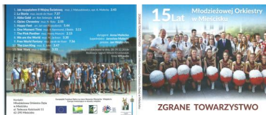
Zgrane towarzystwo, str. 1 i 4.