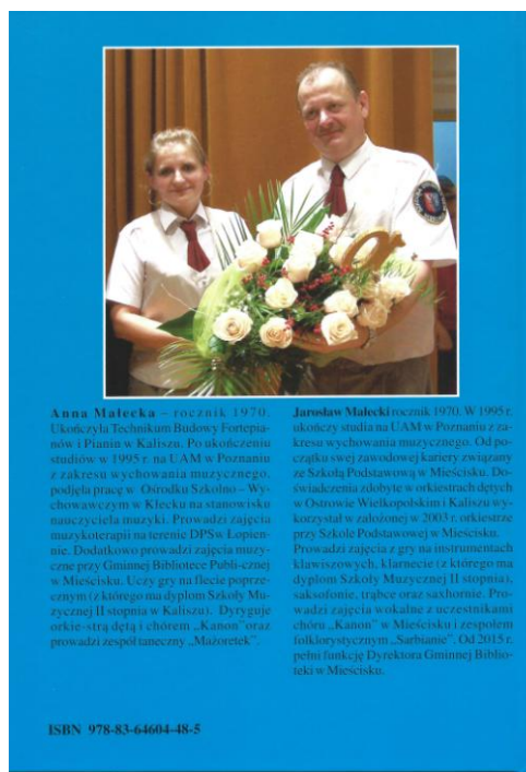
15 – lecie Młodzieżowej Orkiestry Dętej, str. 4