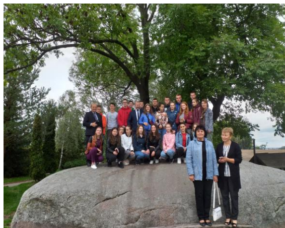
Na Kamieniu Św. Wojciecha w Budziejewku

Po obiedzie był wyjazd do Aquaparku w Wągrowcu. Po powrocie oglądano film pt. „Wrota bohaterów” w kinie „Za Rogiem”. Po filmie był słodki poczęstunek i dyskoteka.