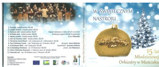
W świątecznym nastroju, str. 1 i 4.