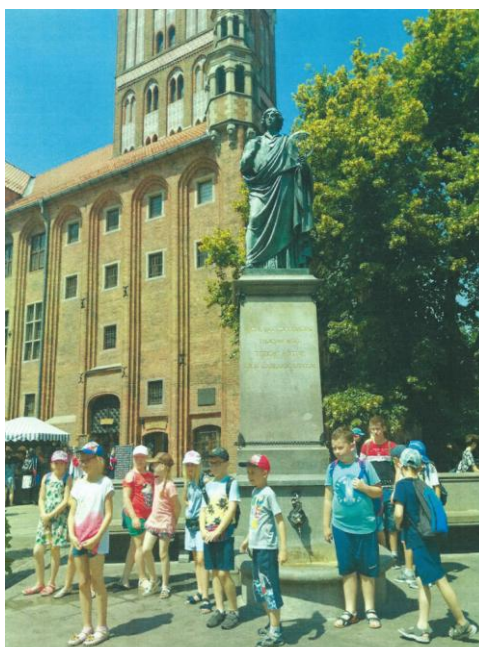
Przy Pomniku Mikołaja Kopernika w Toruniu

Ważnym elementem zadania publicznego jest rozbudowanie w dzieciach zamiłowania do odkrywania ludowych walorów regionów Polski oraz uczenie się szacunku do dorobku kulturowego, jakim jest muzyka oraz sztuka regionalna. Odbiorcami tego zadania publicznego były dzieci uczestniczące w zajęciach zespołu "Jarzębinki" . Jest to przedział wiekowy od 9 do 11 lat. W dobie elektroniki oraz mediów społecznościowych należy wskazywać dzieciom alternatywne formy służące rozwojowi intelektualnemu oraz emocjonalnemu. Wycieczka ma również służyć zintegrowaniu się z rodzicami dzieci z zespołu oraz wskazaniu im możliwości, które płyną z zainteresowania dzieci sferą tańca i sztuki ludowej.