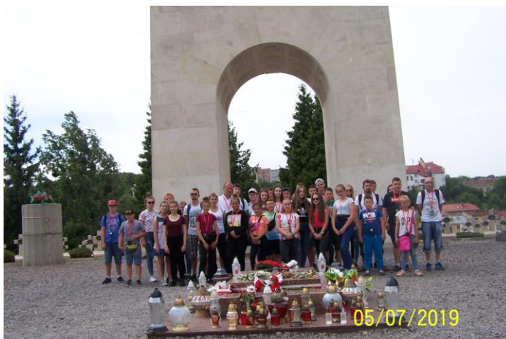
Na Cmentarzu Orłąt Lwowskich we Lwowie

pomocy. Po wykonaniu wielu zdjęć zapierającej dech w piersiach panoramy, zeszliśmy na dół i przejechaliśmy do Zagrody Żubrów w Muczmem. Na miejscu, gospodarz miejsca opowiedział nam