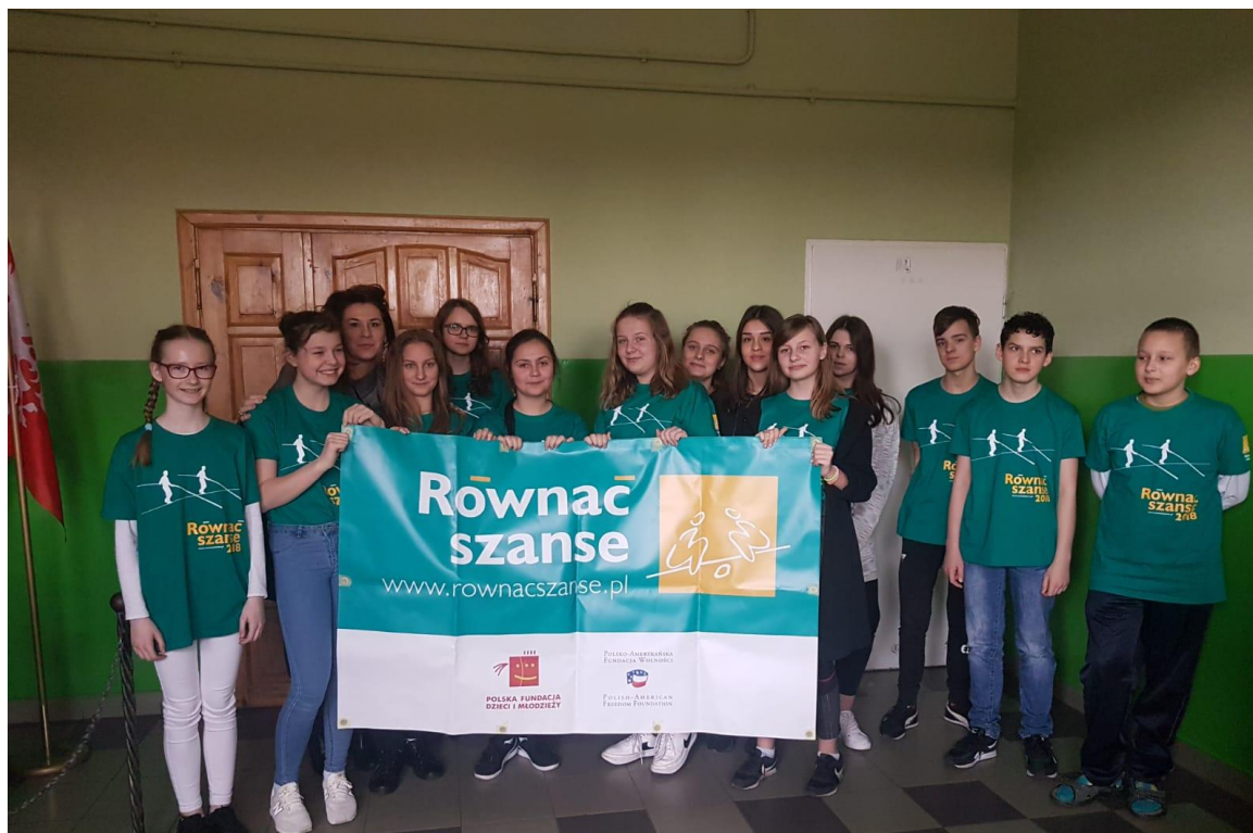
Zespół uczniów biorących udział w realizacji zadania.