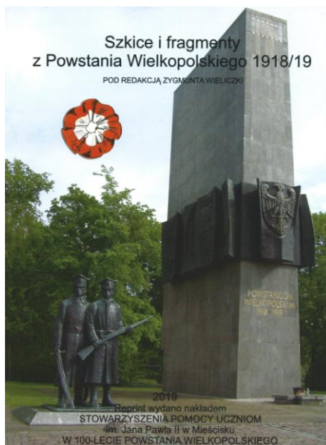
Strona 1 okładki.

Zarząd Stowarzyszenia wystąpił z wnioskiem do Starostwa Powiatowego w Wągrowcu o dofinansowanie wydania ww. publikacji. Wniosek został załatwiony pozytywnie. Otrzymaliśmy dofinansowanie w kwocie 4 500,00 zł. Wydano 350 egzemplarzy książki.