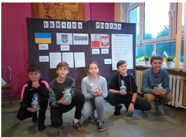
Prezentacja świeczek w kolorach barw narodowych Ukrainy