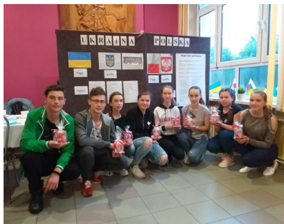
Prezentacja świeczek w kolorach barw narodowych Polski