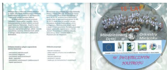
W świątecznym nastroju, str. 2 i 3.