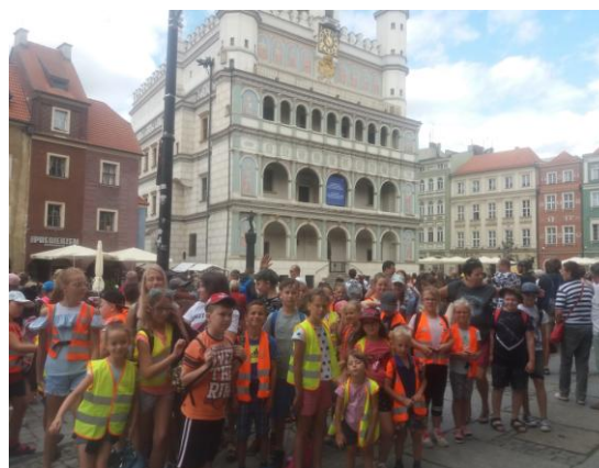
Na Starym Rynku w Poznaniu

Zjadły obiad w restauracji Mc Donald's. Następna wycieczka odbyła się do parku trampolin Jump Word we Wrześni. Po zapoznaniu się z zasadami bezpiecznego korzystania z atrakcji i rozgrzewce, dzieci świetnie się bawiły korzystając z trampolin, koszykówki, siatkówki, równoważni i basenu z piankami. Wycieczka do Wągrowca rozpoczęła się zwiedzeniem wieży widokowej i podziwianiem panoramy Wągrowca. Spotkali się też ze strażakami Państwowej Straży Pożarnej, gdzie zapoznali się z pracą strażaków i obejrzeli wozy bojowe. Po posiłku obejrzeli siedzibę wągrowieckiego radia i zapoznali się z pracą twórców audycji radiowych. Ostatnia wycieczka odbyła się do gospodarstwa agroturystycznego „Ostrówek” w Potulicach, gdzie odbyły