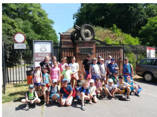
Przed Muzeum Armii Poznań w Poznaniu

Drugą wycieczkę zorganizowano do Nadleśnictwa Durowo, gdzie półkoloniści uczestniczyli w lekcji terenowej, poznając zasoby lasu oraz przybliżyli sobie zasady i potrzebę ochrony lasu. Spacerując po lesie dzieci podziwiałały piękny krajobraz i nasłuchiwały głosów zwierząt. Odbyło się również tam ognisko, gdzie dzieci na świeżym powietrzu mogły zająć się smacznymi kiełbaskami. Podczas kolejnej wycieczki do Wągrowca dzieci zapoznały się z pracą dziennikarzy radiowych,