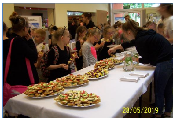
Promocja zdrowego odżywiania.