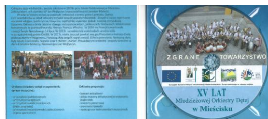
Zgrane towarzystwo, str. 2 i 3.