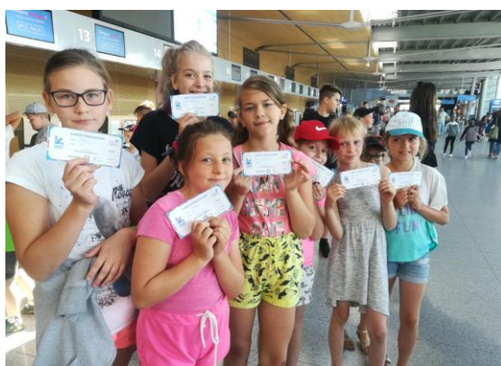
W hali odpraw na Lotnisku Ławica w Poznaniu