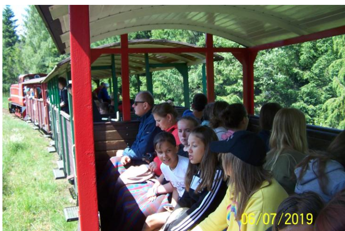
Przejażdżka Bieszczadzką Kolejką Leśną

wiele bardzo ciekawych rzeczy na temat życia tych dużych ssaków. Mieliśmy duże szczęście i udało nam się dość dobrze zobaczyć zwierzęta, co wcale nie jest takie oczywiste, ponieważ często, ze strachu przed obcymi ludźmi, ukrywają się.