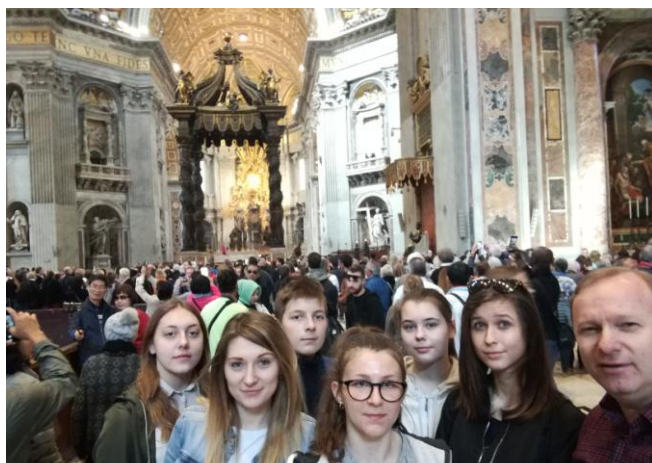
W Bazylice Św. Piotra

Odwiedziliśmy też m.in. śliczną Fontannę Di Trevi, niesamowity Panteon, Bazylikę św. Pawła za Murami i Bazylikę na Lateranie. Cieszę się, że mogłam zobaczyć Forum Romanum, ponieważ interesuję się historią, szczególnie tamtych czasów, i było to dla mnie bardzo ciekawe. Fascynujące jest to, że w tych czasach możemy zobaczyć jak wyglądał starożytny Rzym i jak ludzie wtedy żyli.